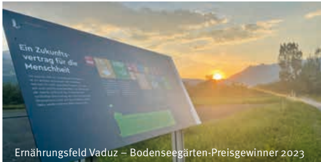
Ernährungsfeld Vaduz – Bodenseegärten-Preisgewinner 2023