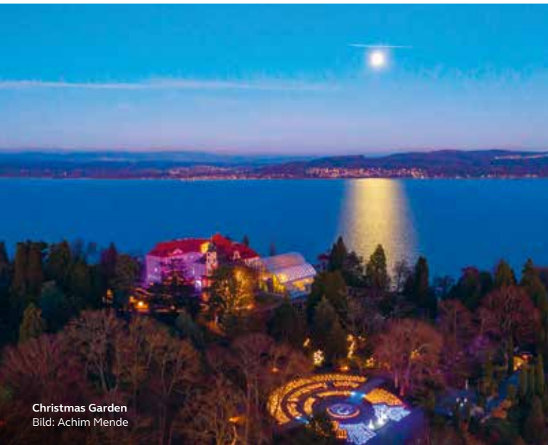
Christmas Garden