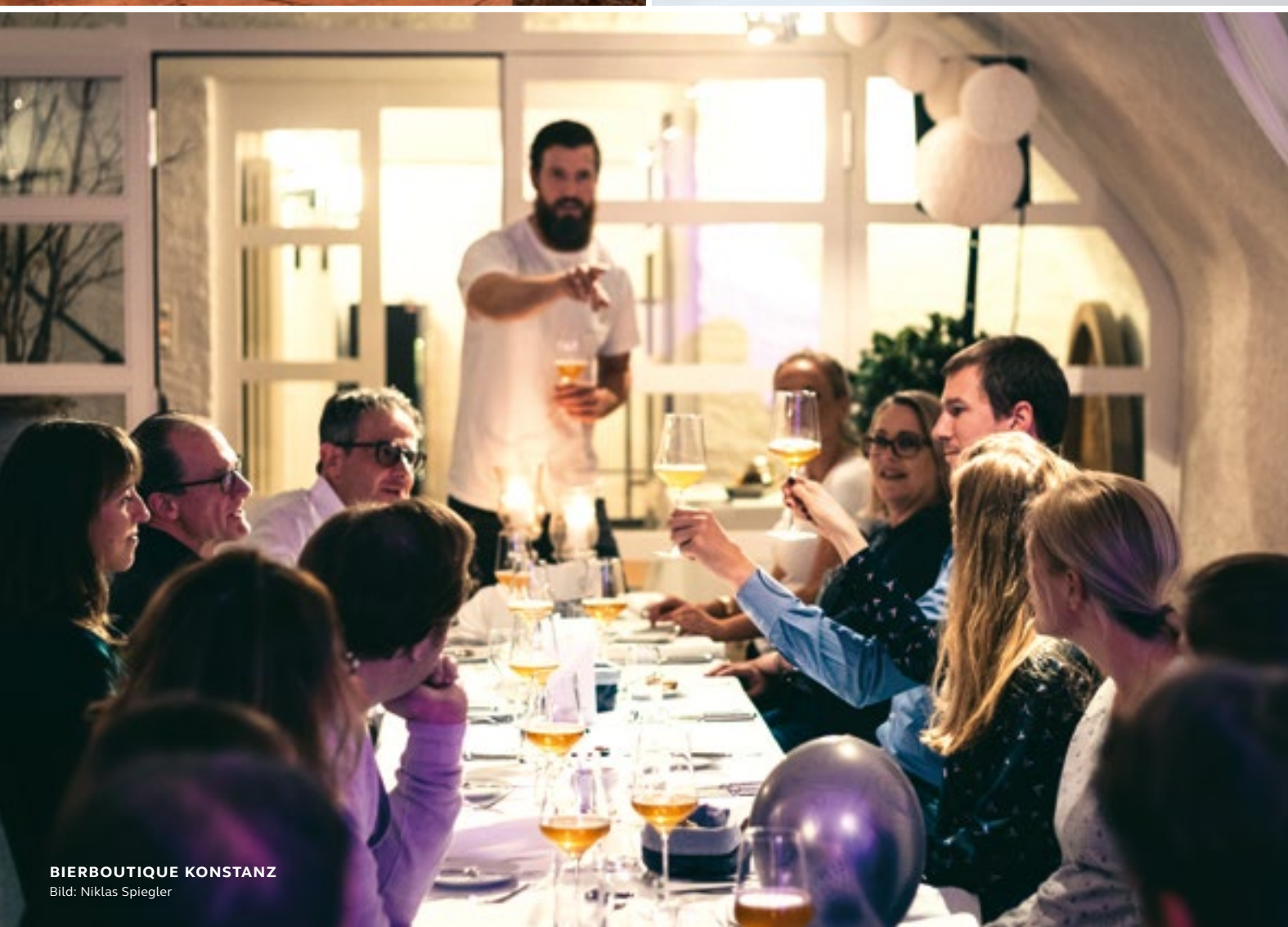
BIERBOUTIQUE KONSTANZ