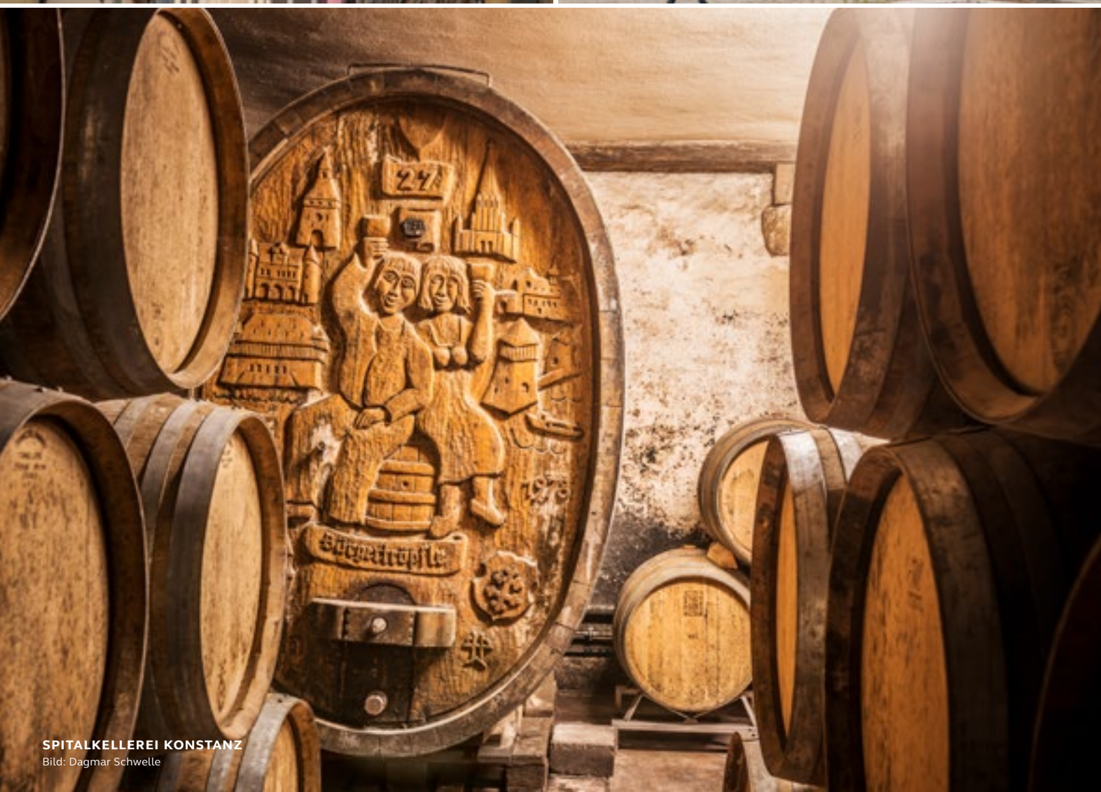
SPITALKELLEREI KONSTANZ