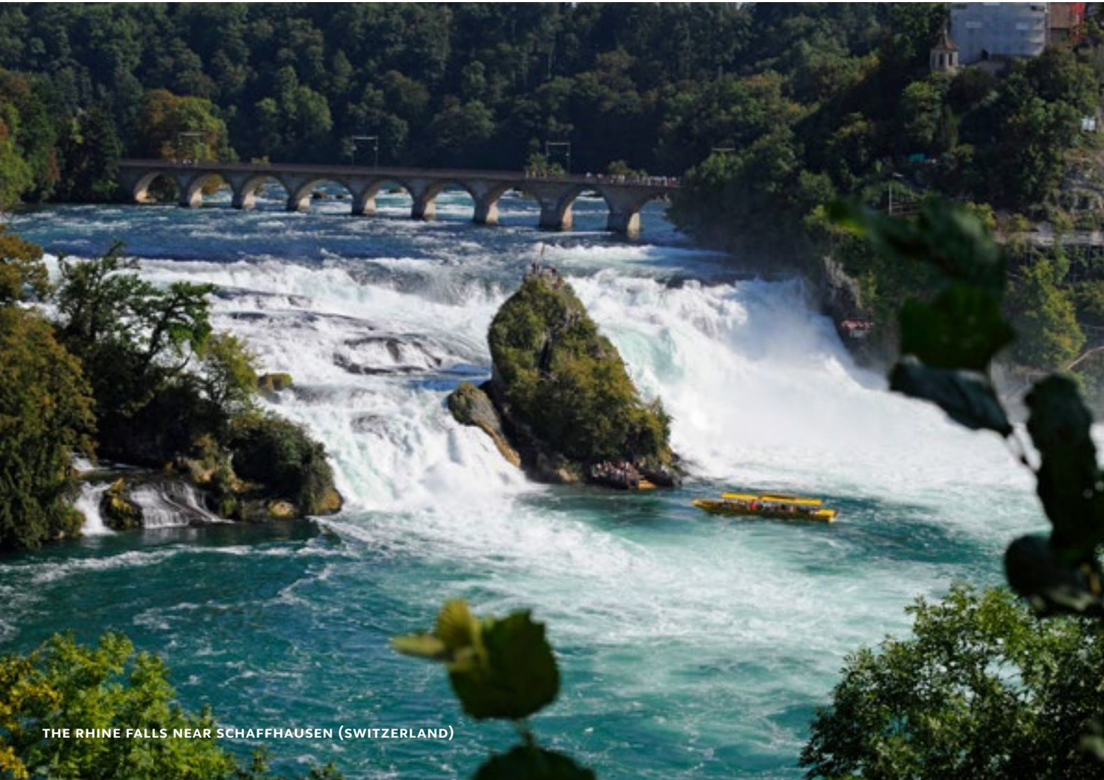
THE RHINE FALLS NEAR SCHAFFHAUSEN (SWITZERLAND)

This tour can be combined with a tour of Meersburg or a tour of Constance.