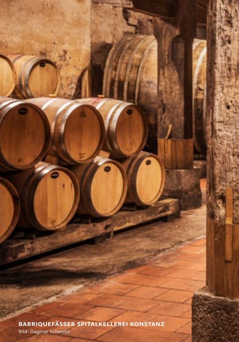
BARRIQUEFÄSSER SPITALKELLEREI KONSTANZ Bild: Dagmar Schwelle