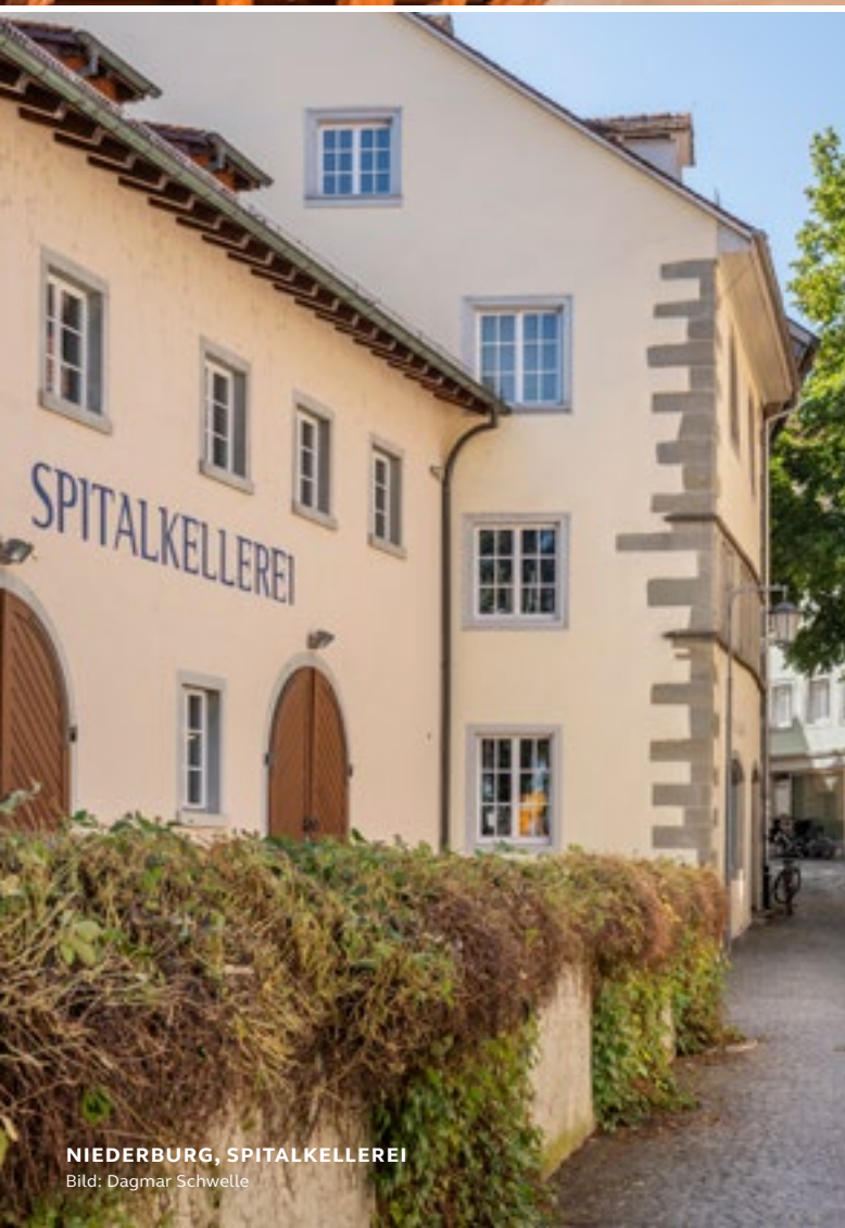
NIEDERBURG, SPITALKELLEREI