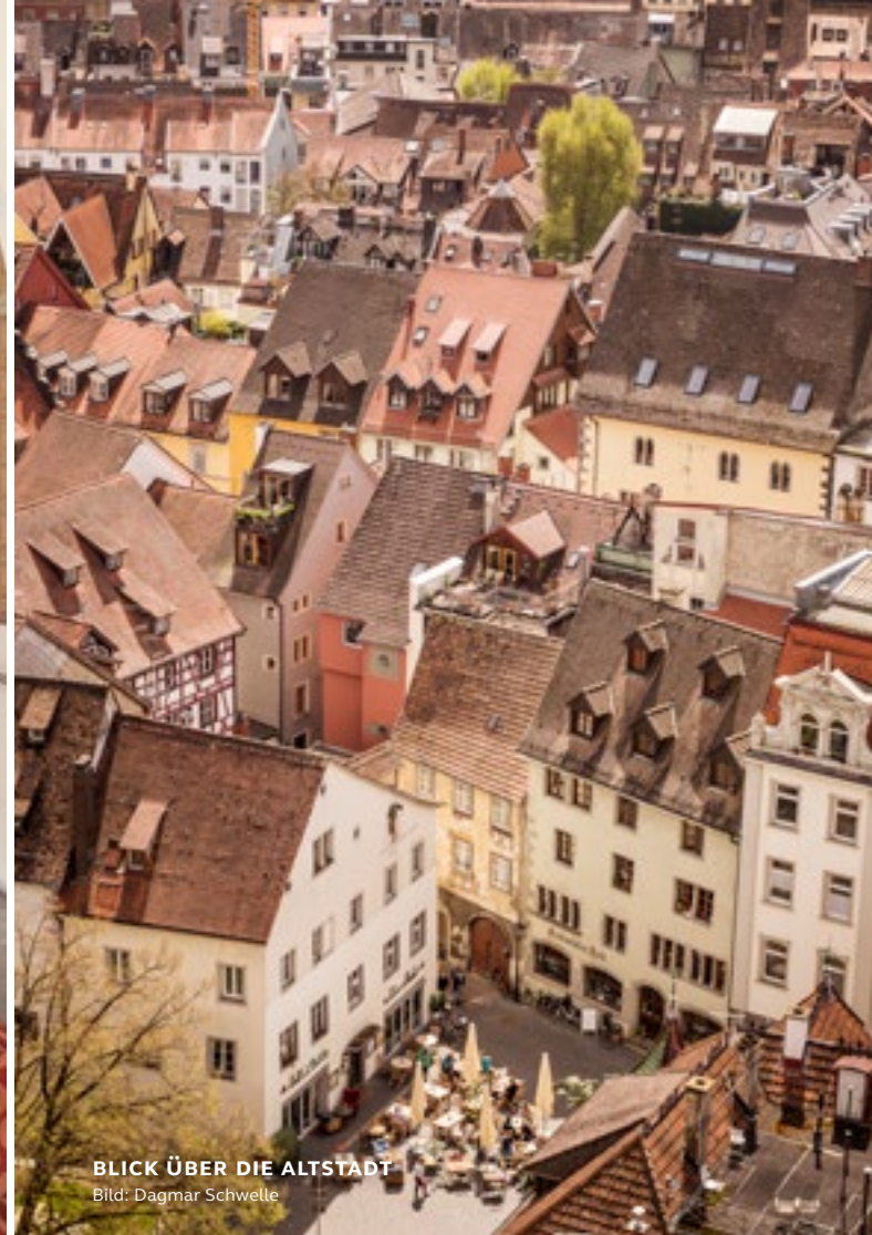
BLICK ÜBER DIE ALTSTADT