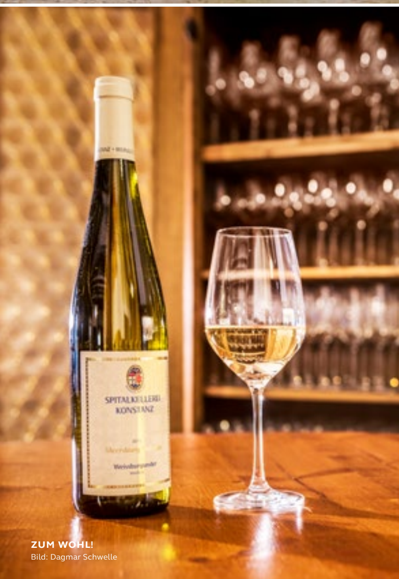
ZUM WOHL!