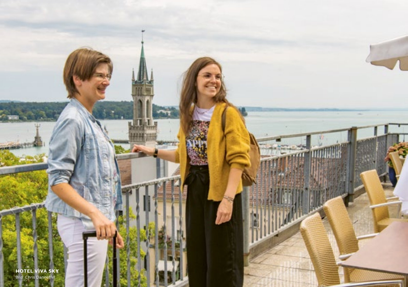
HOTEL VIVA SKY