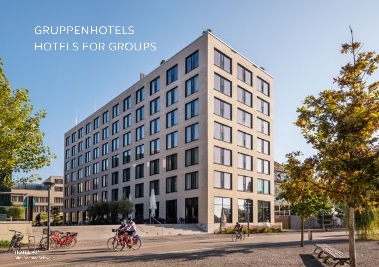
HOTEL 47°