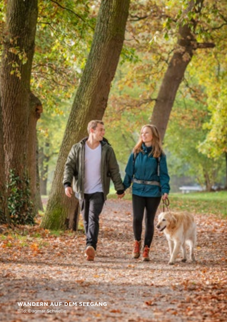
WANDERN AUF DEM SEEGANG