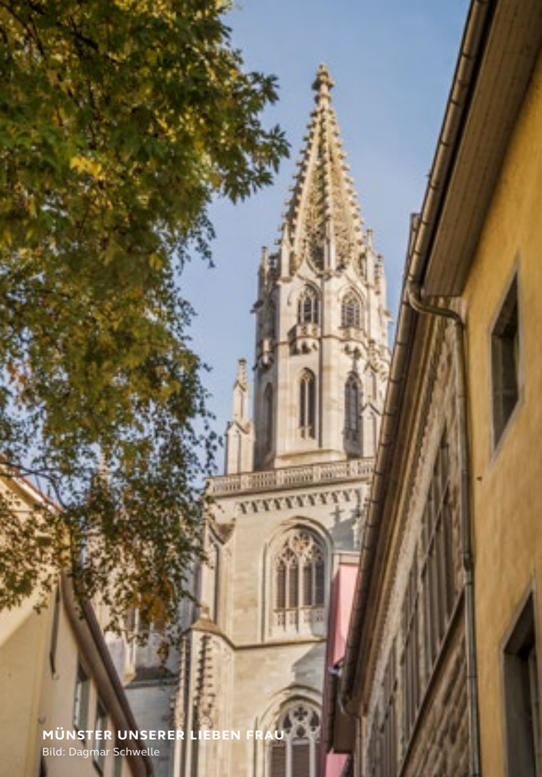
MÜNSTER UNSERER LIEBEN FRAU