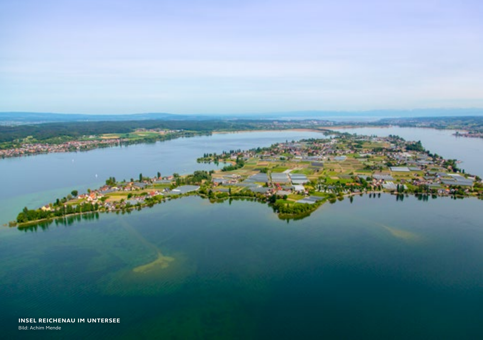
INSEL REICHENAU IM UNTERSEE

INSEL REICHENAU – UNESCO-WELTERBE Die größte Insel des Bodensees ist für ihre einzigartige Geschichte, ihre bedeutsamen Kirchen und Klöster sowie weite Felder mit Obst- und Gemüseanlagen und Weinbergen direkt am See bekannt. Von Konstanz aus geht es über eine Pappelallee und einen Damm auf die Welterbeinsel. TeilnehmerInnen können auf dieser Tour u.a. die ehemaligen Stiftskirchen St. Georg, St. Peter und Paul sowie das Münster mit ihrer beeindruckenden Schatzkammer besichtigen. Auch der berühmte Kräutergarten von Wallahfried, der im 9. Jahrhundert das vermutlich erste Buch zum Gartenbau schrieb sowie auf Wunsch eine Kaffee- und Kuchenpause sind Teil dieses Ausflugs.