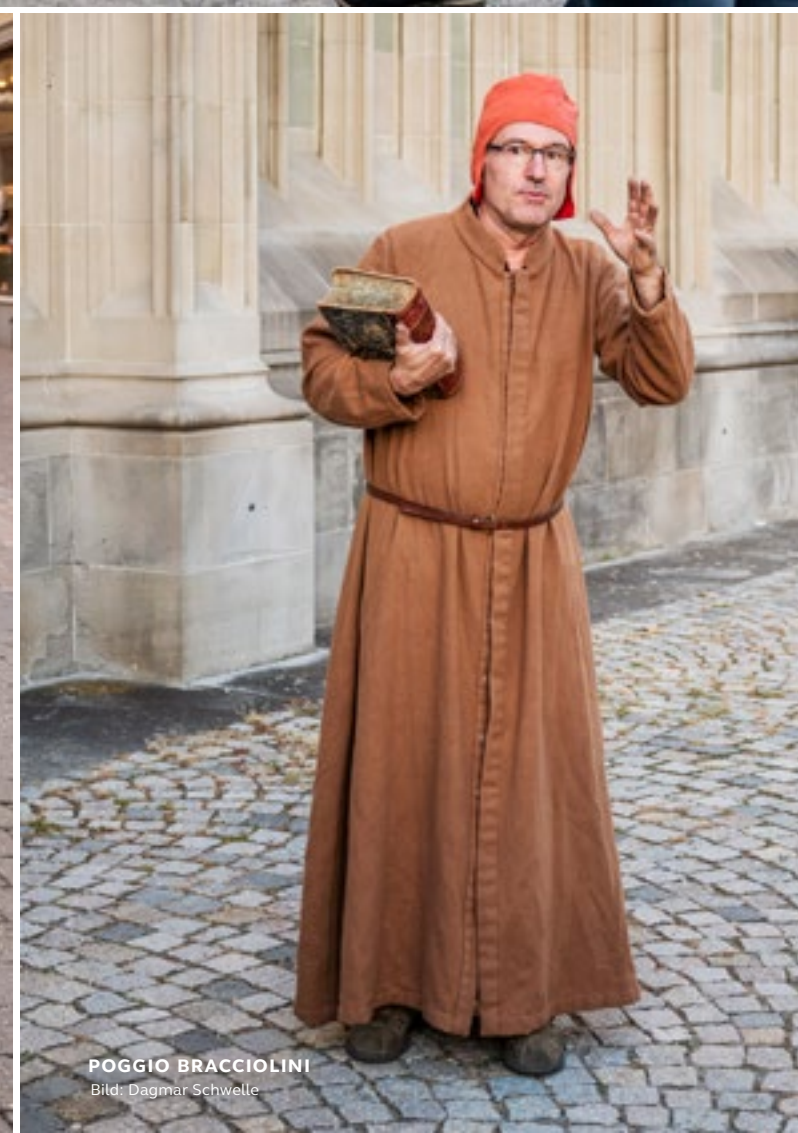
POGGIO BRACCIOLINI