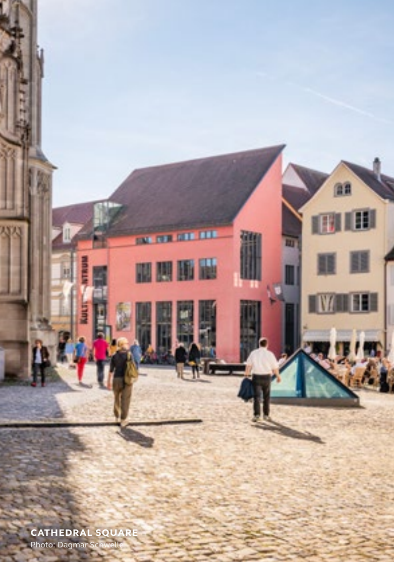
CATHEDRAL SQUARE