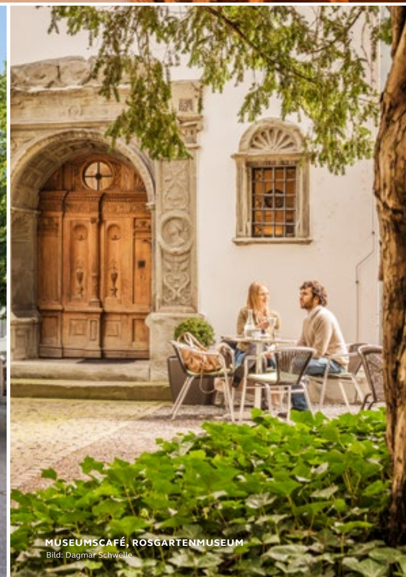
MUSEUMSCAFÉ, ROSGARTENMUSEUM