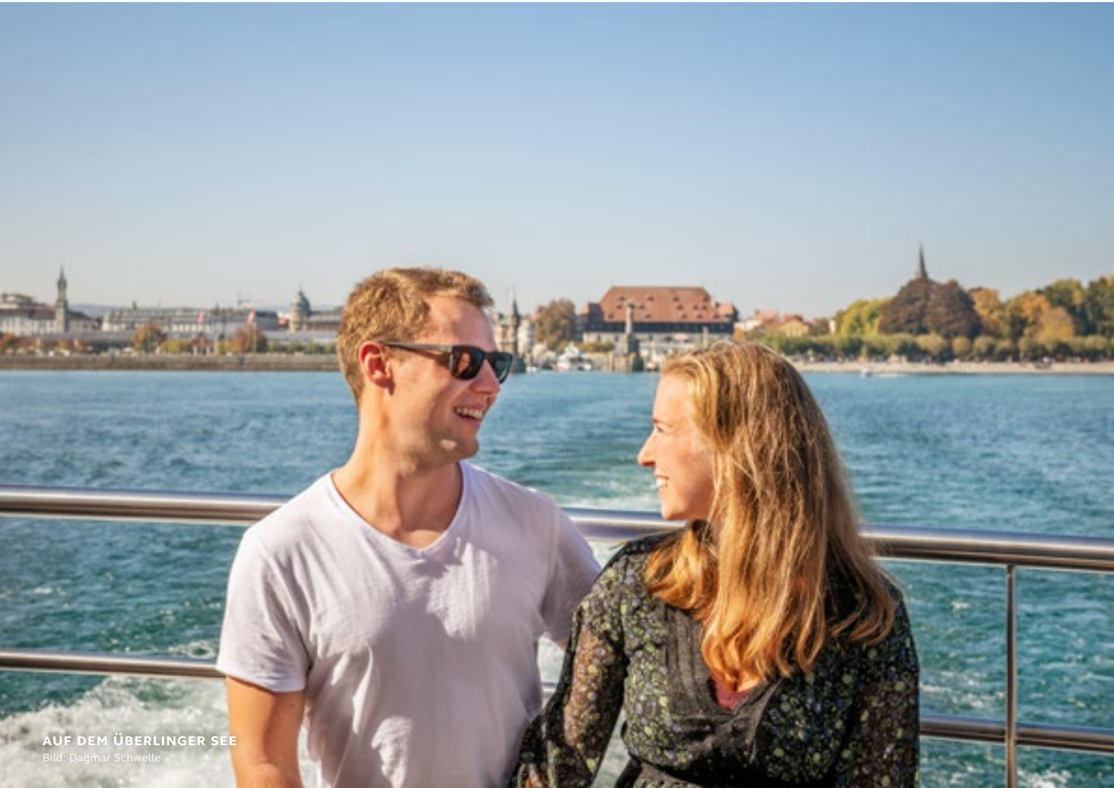
AUF DEM ÜBERLINGER SEE

→ www.konstanz-tourismus.de/genuss-schiffe