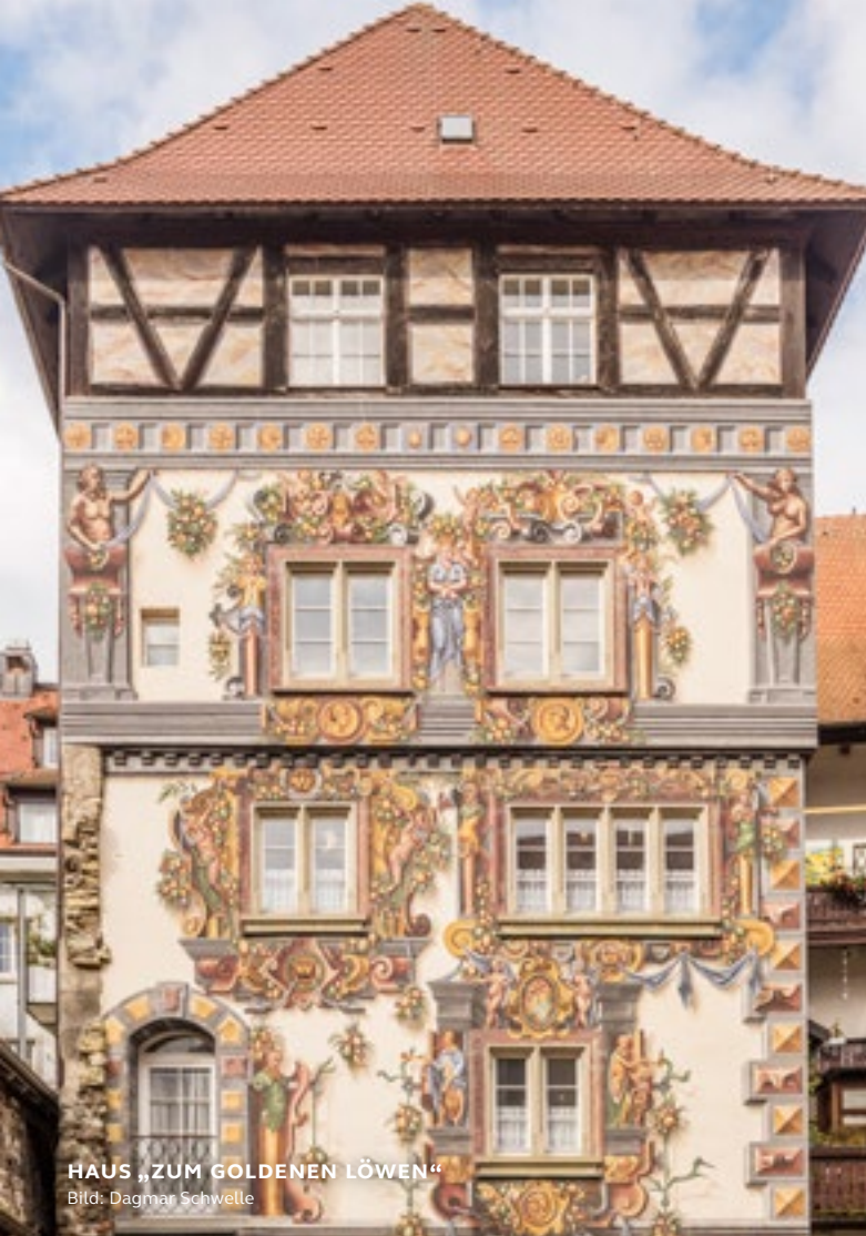
HAUS „ZUM GOLDENEN LÖWEN“