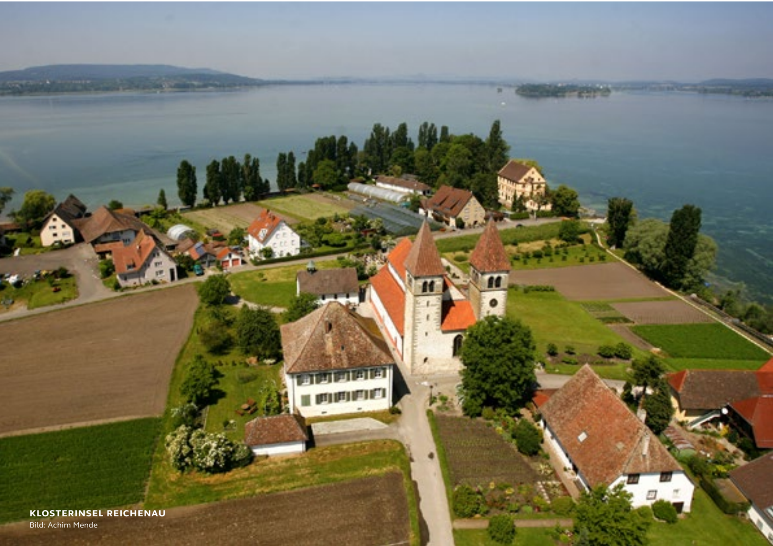
KLOSTERINSEL REICHENAU

PANORAMA-WANDERUNG – VOM SEE ZU DEN KONSTANZER WEINBERGEN Der Geschichte auf der Spur: Vorbei an herrschaftlichen Villen und stillen Häusersiedlungen bis zur Loretto-Kapelle und dem Bismarckturm mit seinen innerstädtischen Weinbergen erkunden die TeilnehmerInnen dieser geführten Rundwanderung den größten Stadtteil von Konstanz, Petershausen. Neben einem umfangreichen geschichtlichen Einblick fasziniert die gemeinsame Wanderung vor allem durch seine einzigartigen Panoramablicke auf die majestätische See- und Alpen-Kulisse sowie die facettenreiche Flora und Fauna am Bodensee.