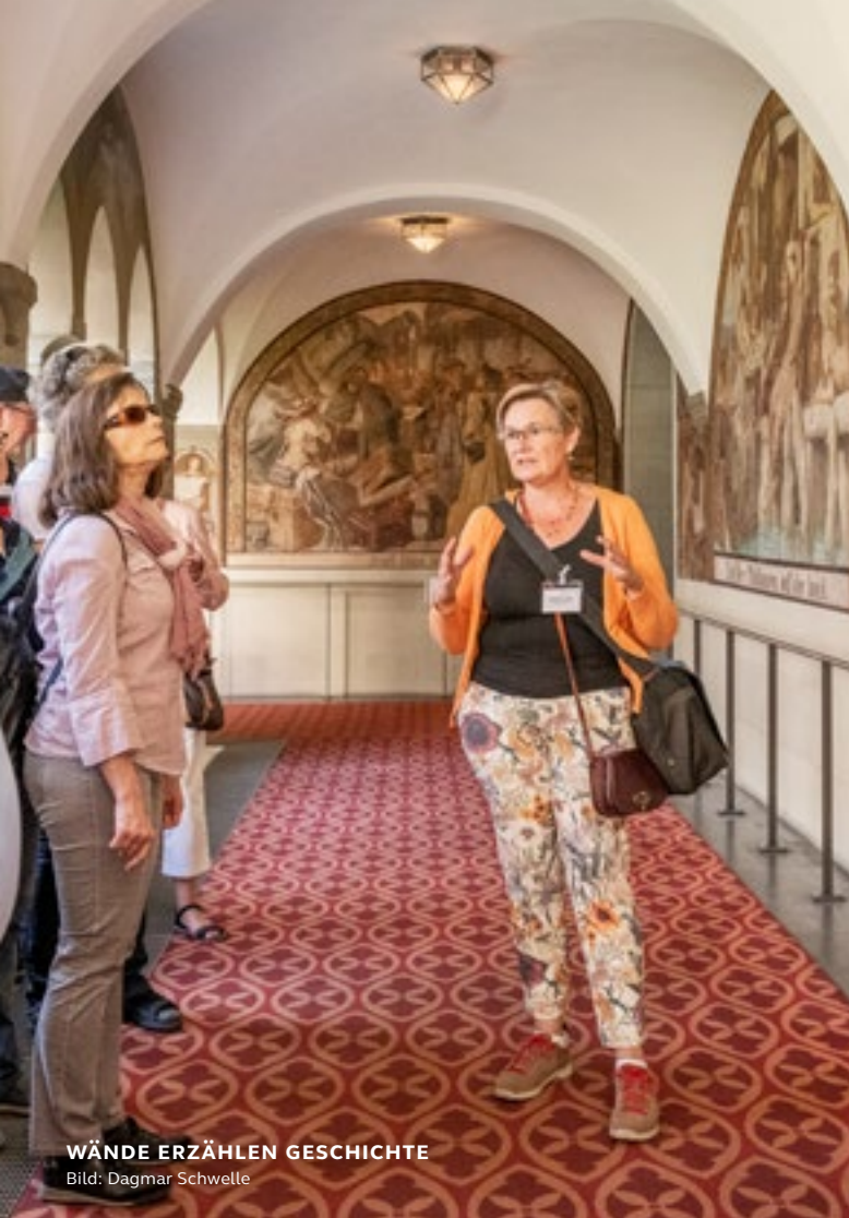
WÄNDE ERZÄHLEN GESCHICHTE