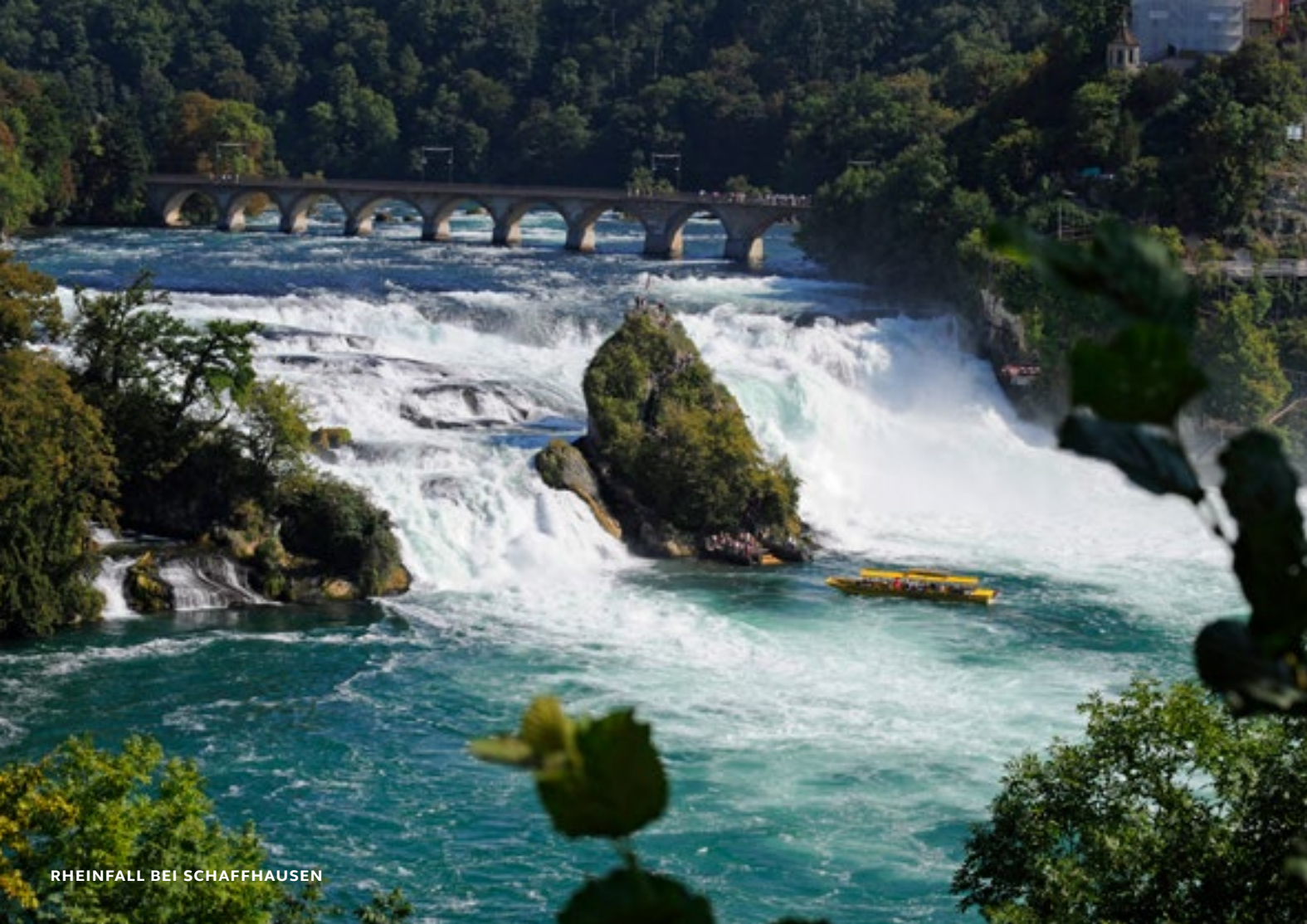
RHEINFALL BEI SCHAFFHAUSEN