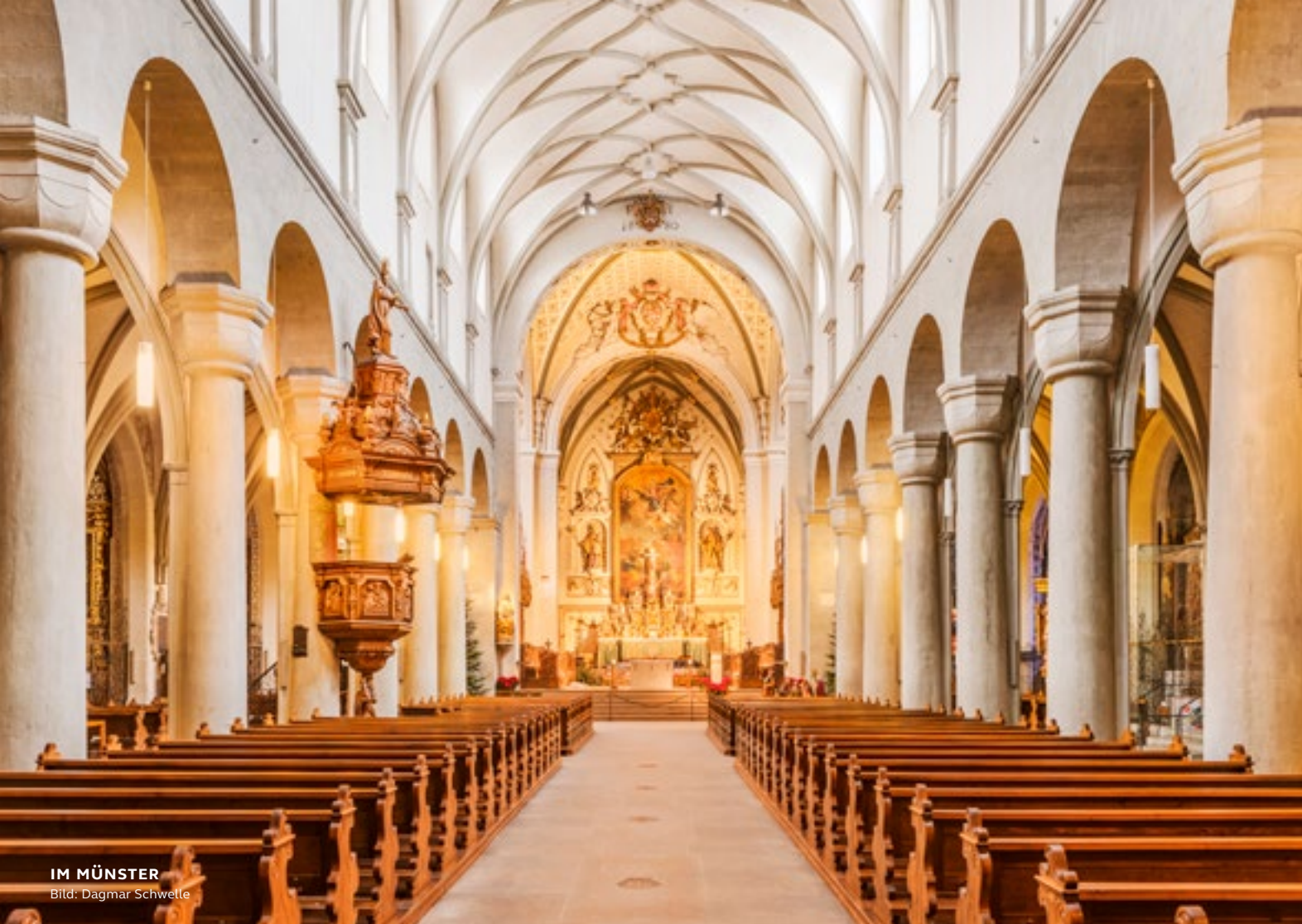
IM MÜNSTER