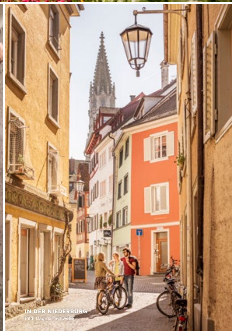
IN DER NIEDERBURG