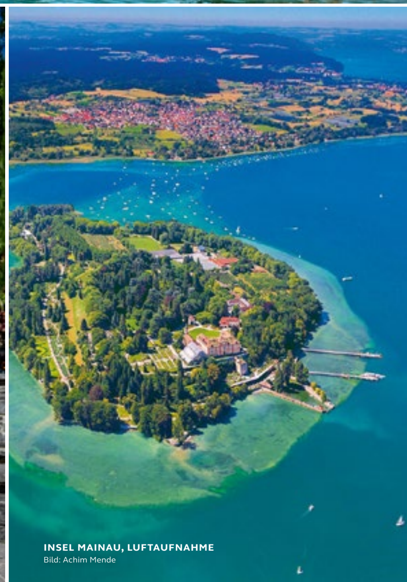
INSEL MAINAU, LUFTAUFNAHME