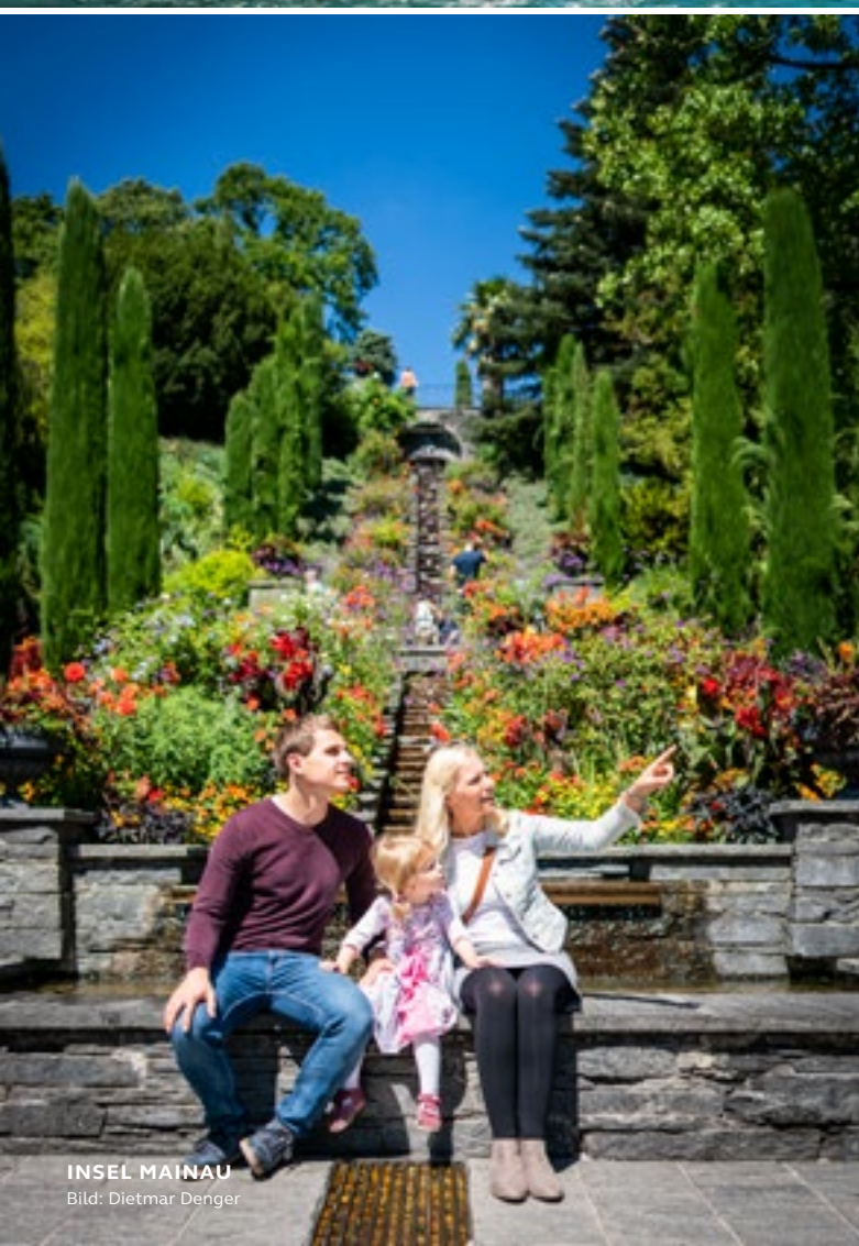
INSEL MAINAU