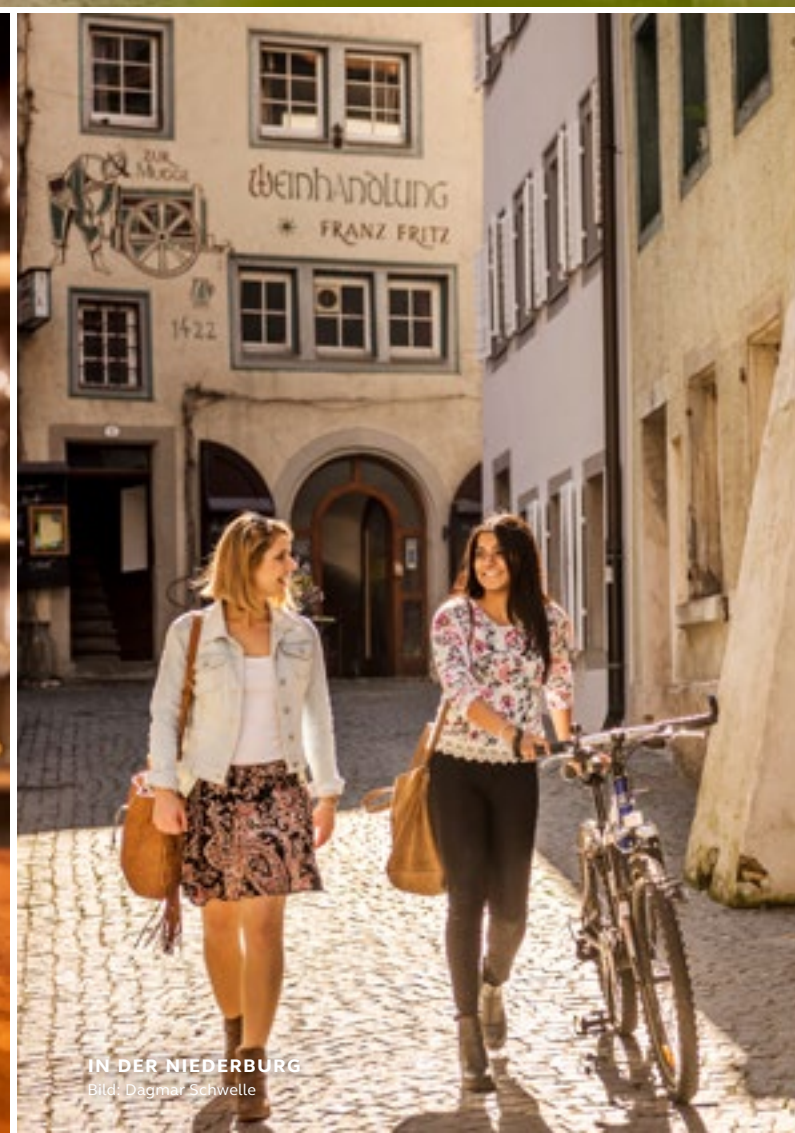
IN DER NIEDERBURG