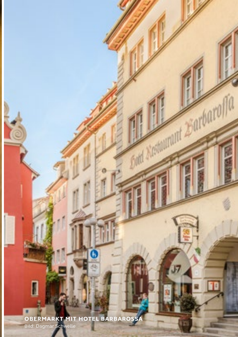
OBERMARKT MIT HOTEL BARBAROSSA