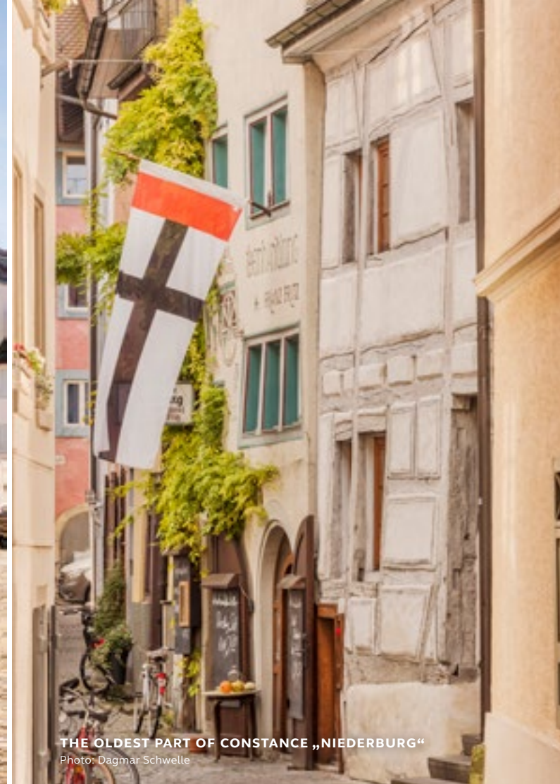
THE OLDEST PART OF CONSTANCE „NIEDERBURG“