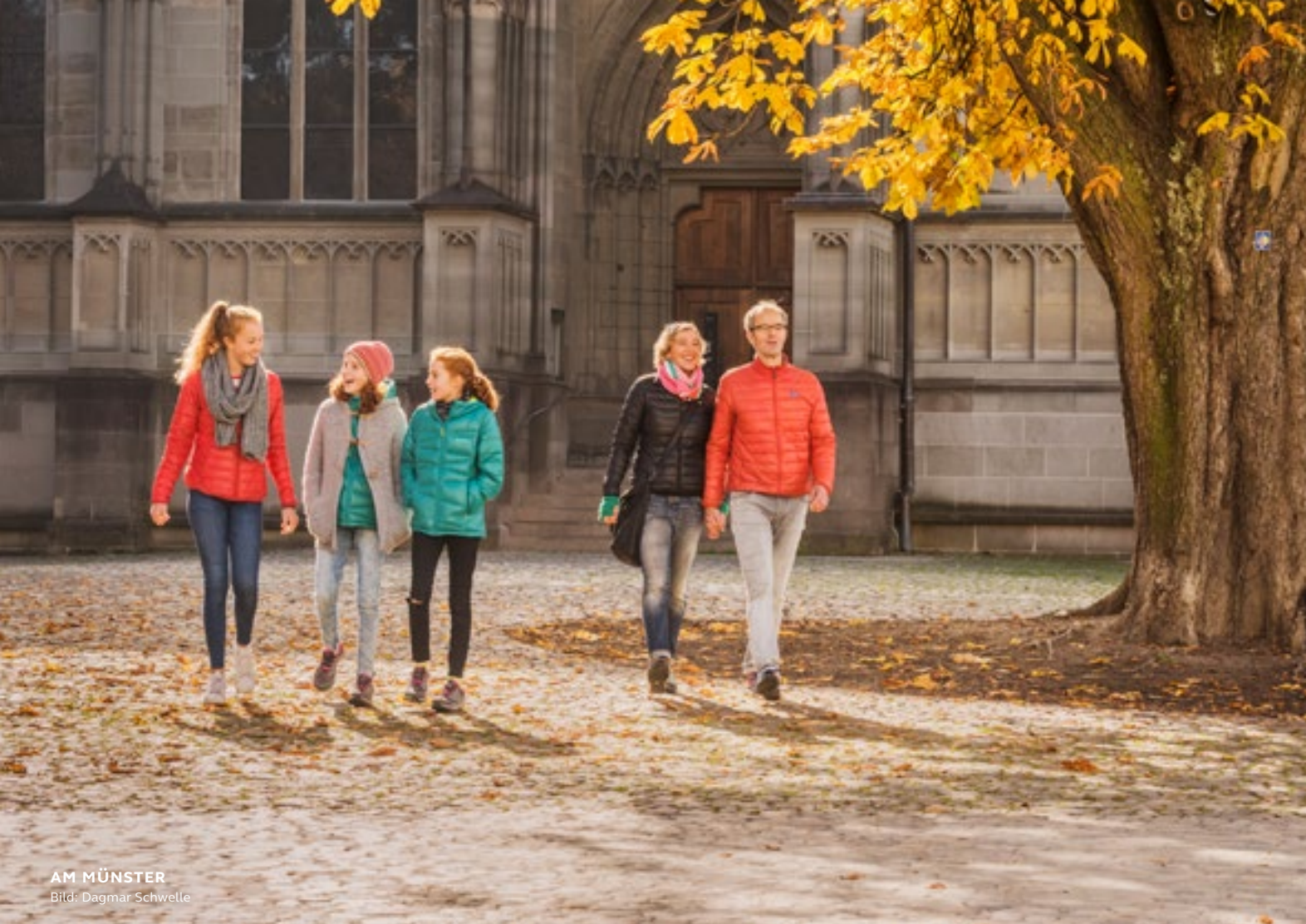
AM MÜNSTER