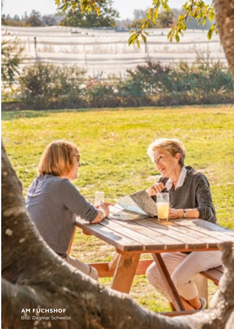
AM FUCHSHOF