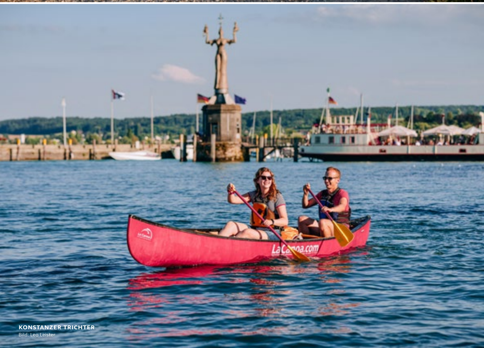
KONSTANZER TRICHTER