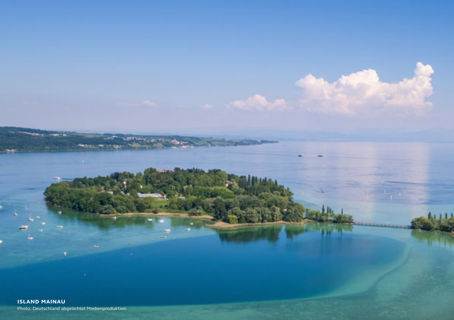
ISLAND MAINAU

You will travel to the beautiful Flower Island by passenger ship via Meersburg. A tour guide will accompany you and introduce you to the lovingly designed gardens including sub-tropical plants and an impressive selection of rare trees. You will also visit the „Palm House“ and fascinating „Butterfly House“. The return trip to Constance is also by ship. Afterwards, or before, if you like, you can take a tour of the city of Constance.