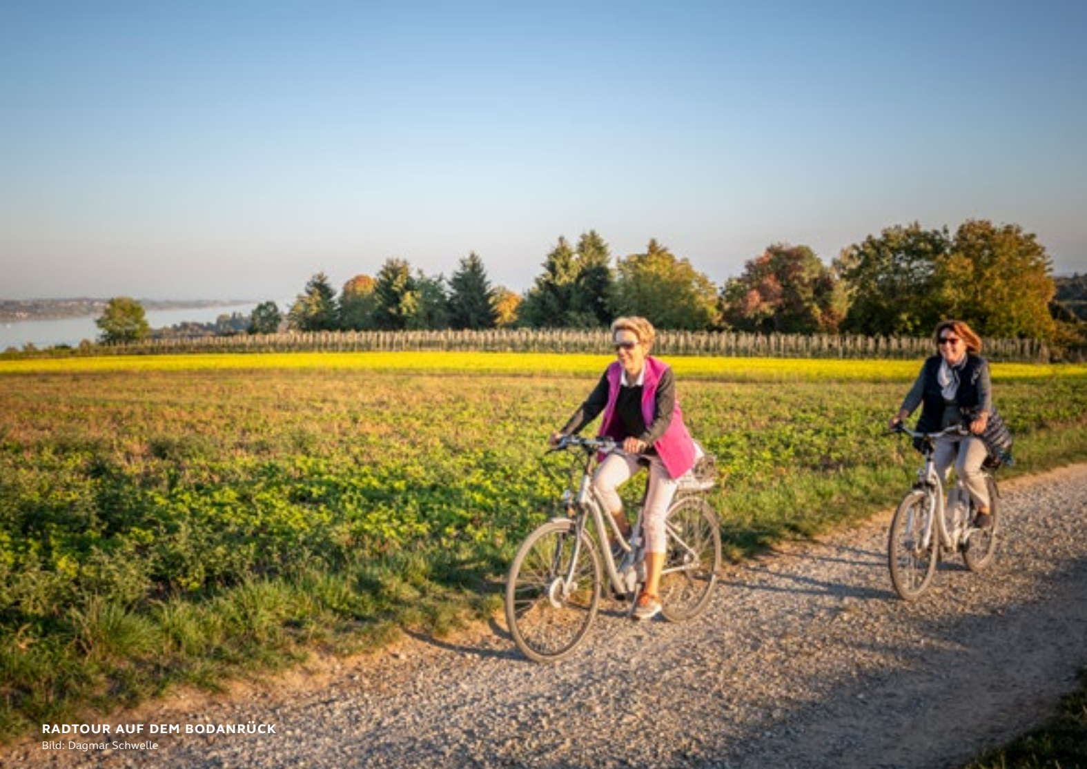
RADTOUR AUF DEM BODANRÜCK