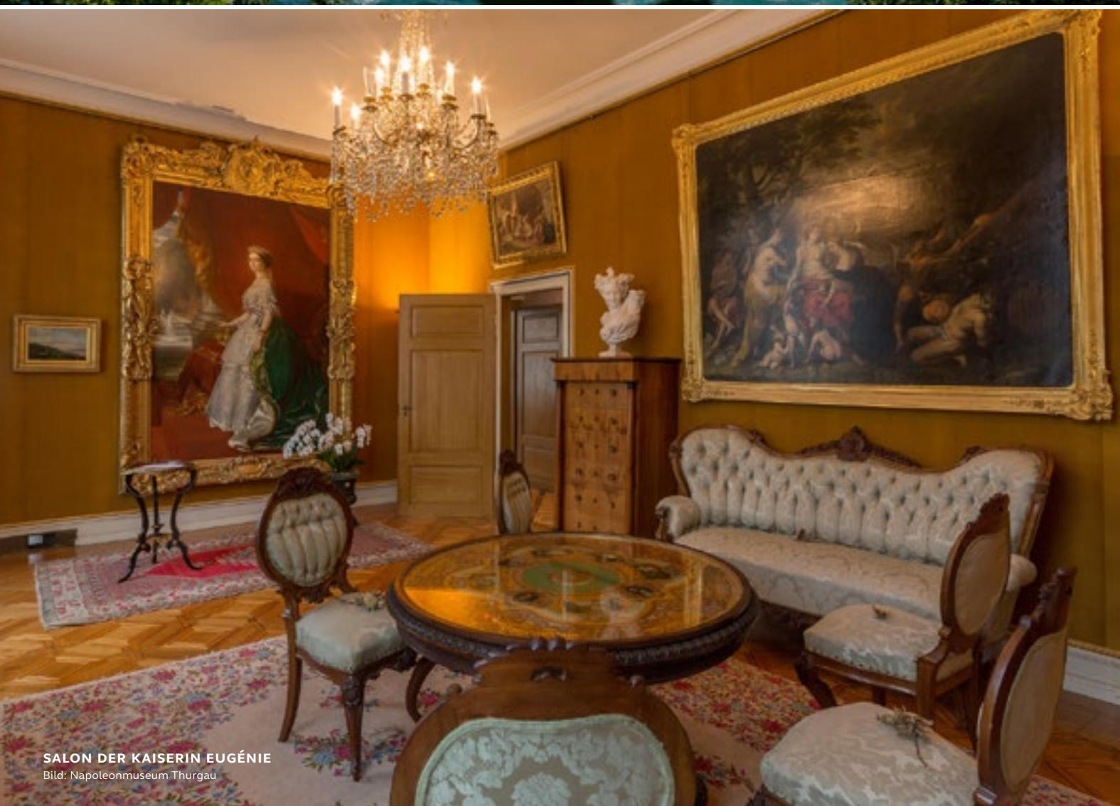
SALON DER KAISERIN EUGÉNIE

Der Ausflug mit dem Bus ist eine ideale Alternative für Zeiten, in denen die Rheinschifffahrt eingestellt ist. Hierbei bietet sich ein Besuch des Schlosses Arenenberg (S. 45) an.