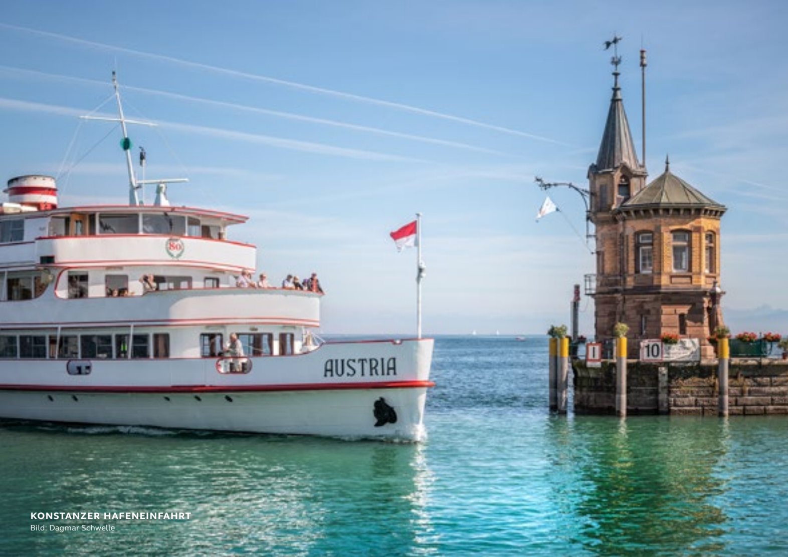
KONSTANZER HAFENEINFAHRT