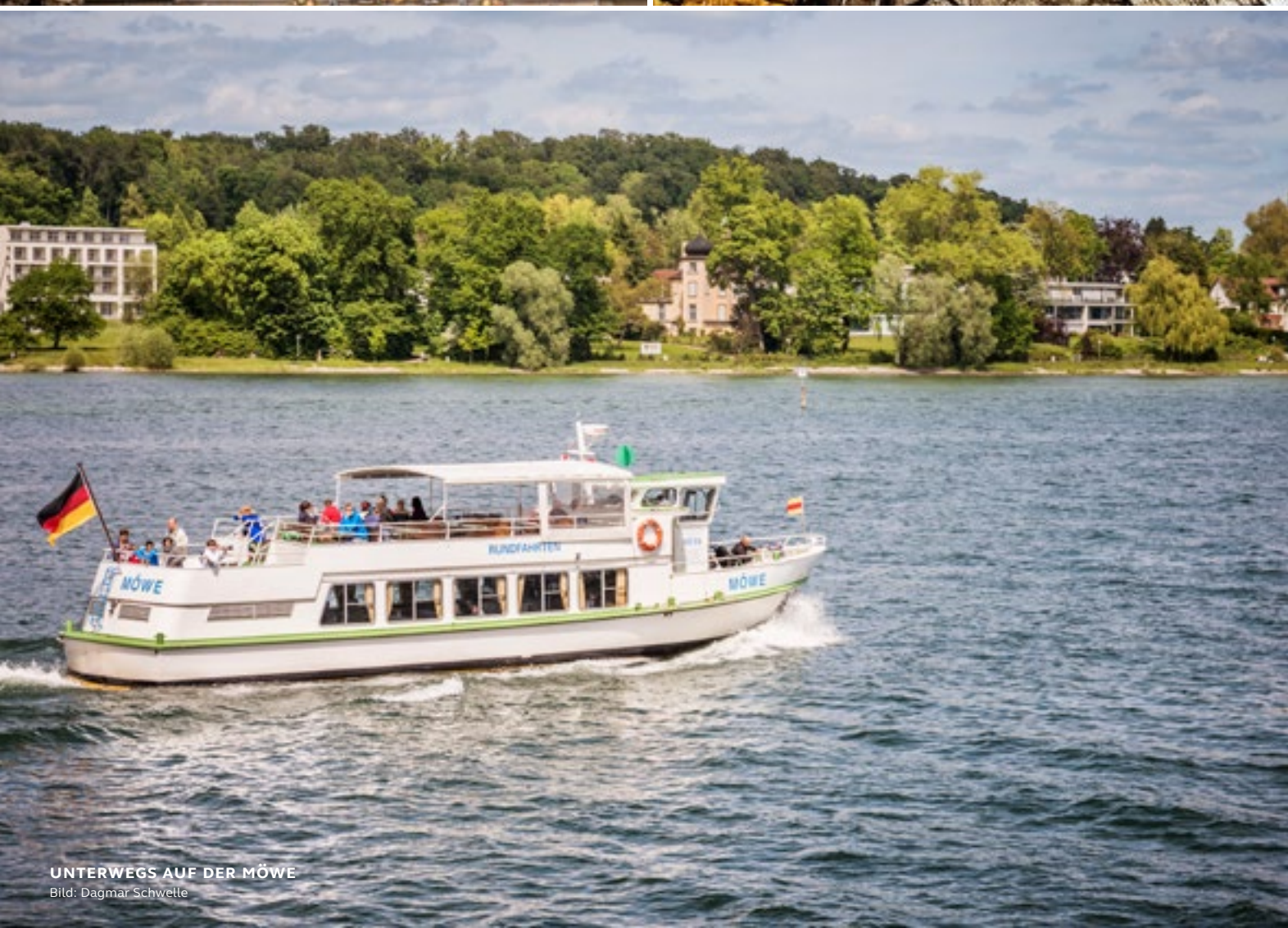
UNTERWEGS AUF DER MÖWE