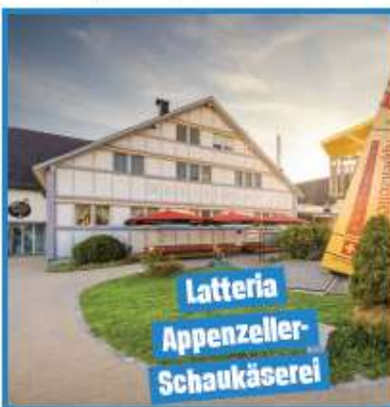
Latteria Appenzeller Schaukäserei