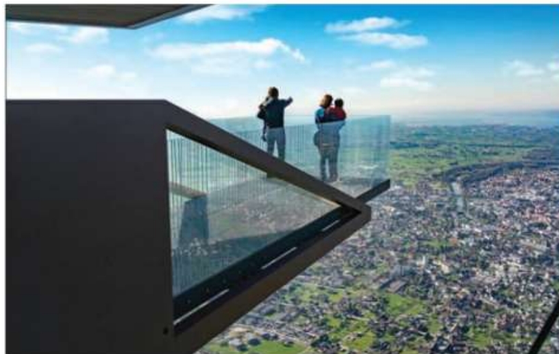
La passerella sul Monte Karren. In basso a destra, il Museo delle palafitte.

Il lago di Costanza è il terzo lago più grande d'Europa, un immenso e preziosissimo serbatoio naturale di acqua potabile con una superficie di 572 chilometri quadrati e 273 chilometri di rive.