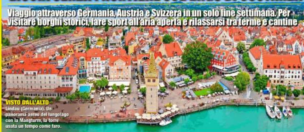
VISTO DALL'ALTO Lindau (Germania). Un panorama aereo del lungolago con la Mangturm, la torre usata un tempo come faro.

Viaggio attraverso Germania, Austria e Svizzera in un solo fine settimana. Per visitare borghi storici, fare sport all'aria aperta e rilassarsi tra terme e cantine