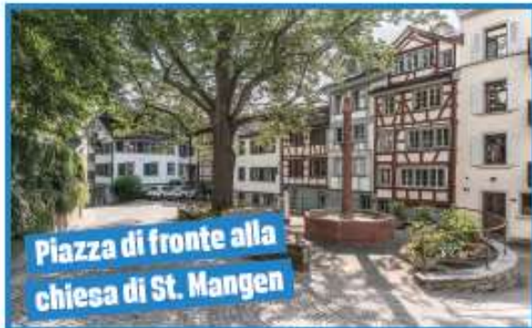
Piazza di fronte alla chiesa di St. Mungen