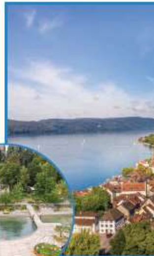
Serre e aiuole sull'acqua

Anche lungo la riva nord del lago è possibile compiere piacevoli passeggiate ed escursioni in e-bike, lasciandosi cullare dalle placide onde del bacino idrico da un lato e dal verde dei prati e delle coltivazioni, intervallate da borghi e casupole, dall'altro. Il clima mite del lago ha richiamato negli anni