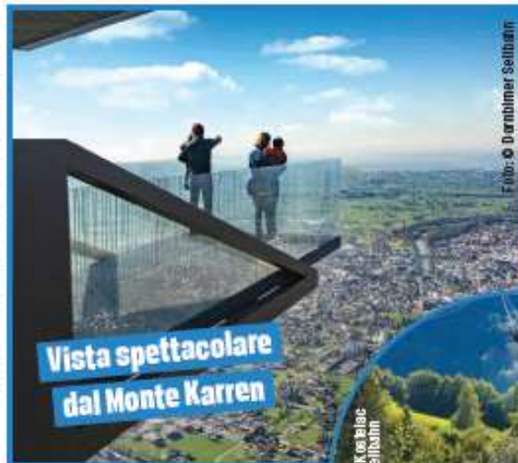
Vista spettacolare dal Monte Karren

All'estremo orientale dallo specchio d'acqua del lago di Costanza, per 28 Km di costa, si aggancia la regione austriaca del Voralberg: una zona che offre un'ampia varietà di scenari naturali e offre molto al turismo naturalistico, preservando ampie zone boschive e proponendo percorsi cicloturistici ed escursionistici tra i più suggestivi e curati d'Europa. Corsi d'acqua e ruscelli che si insinuano nelle foreste, numerosi animali e specie rare preservate e rilievi montuosi come quello del Karren , alto 976 metri, che domina la cittadina di Dornbirn , anch'esso facilmente raggiungibile in funivia, per godere dal rifugio in vetta della suggestiva vi-