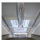
Modello Hindenburg Zeppelin Museum