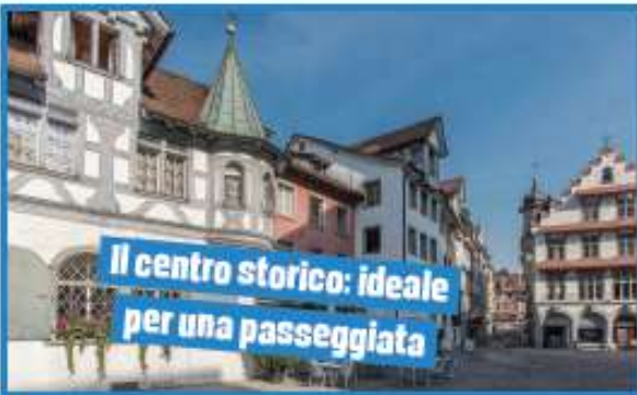
Il centro storico: ideale per una passeggiata