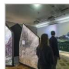
Erste Bilder vom neu sanierten Cavazzen