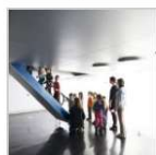
Ricostruzione Zeppelin Museum