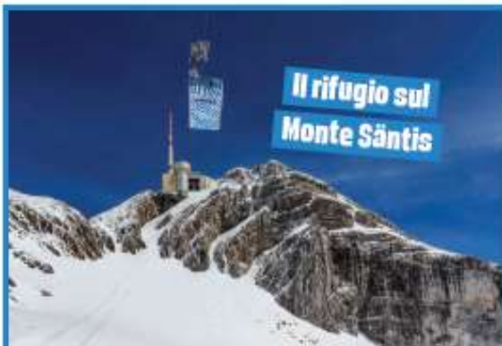
Il rifugio sul Monte Säntis