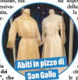
Abiti in pizzo di San Gallo

In alcuni periodi storici, la produzione del lino sangalense raggiunge anche il 50 per cento di quella mondiale, ma fu poi progressivamente sostituita, con il diffondersi dell'industrializzazione, da quella del più economico cotone. La città si specializzò allora nella produzione dei famosi "pizzi", che resero San Gallo famosa in tutto il mondo. Non a caso questi prodotti di alta qualità e artigianeria venivano definiti "l'oro bianco" di San Gallo. La testimonianza della tradizione tessile di San Gallo può essere ripercorsa nel Tex-