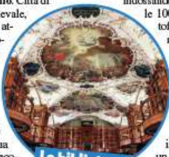
La biblioteca di San Gallo