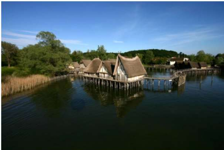
Il Museo delle Palafitte di Ultingen

Anche i Romani arrivarono sul Bodensee, facendo di Bregenz, antica Brigantium , un avamposto importante nell'area. Secondo la leggenda, il monaco irlandese Gallo fondò la città che ancora porta il suo nome nel 602 d.C. La comunità monastica che qui crebbe divenne una delle più importanti del medioevo, ed oggi il complesso monastico, la cattedrale e la biblioteca di San Gallo sono un patrimonio sotto l'egida dell'Unesco . Testimonianze dell'epoca barocca si trovano sparse in tutto il territorio del Lago di Costanza, come per esempio il Castello Nuovo di Meersburg e la basilica di Birmau. A Friedrichshafen, infine, si entra nella storia del XX secolo, con il Museo Zeppelin, dedicato ai dirigibili che furono in funzione fino a pochi anni prima della II Guerra Mondiale, dominando l'epoca delle "navi dei cieli".