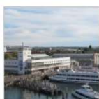
Das Zeppelin Museum.