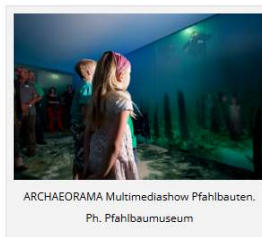
ARCHAEOGRAMA Multimediashow Pfahlbauten, Ph. Pfahlbaumuseum

Una vacanza sul Lago di Costanza non è solo relax: è un viaggio tra natura, cultura, gusto e meraviglia, dove ogni tappa diventa un ricordo indelebile.