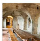
Burg Meersburg, Sala dei cavalieri