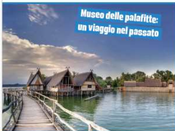
Museo delle palafitte: un viaggio nel passato

e dalla buona cucina locale, eleggendo queste zone fin dall'800 a luogo privilegiato di villeggiatura, con presenza di spa e bagni termali accanto a vestigia del passato. Un esempio è la cittadina di Überlingen , la cui storia affonda addirittura nell'epoca romana, ma che negli ultimi anni ha reinventato i suoi spazi verdi e ridisegnato la promenade sul lago, arricchendosi di aree di gioco e svago: un per-