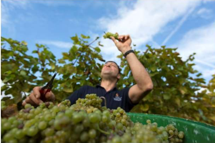
Vigne in Hagau

A Immenstaad si può visitare la casa vinicola Roehrenbach dove ebbero inizio le fortune del Müller-Thurgau e pernottare con vista idilliaca sui vigneti e sulle acque del lago. La cantina è ancora di proprietà della famiglia del giovane viticoltore che, in una notte di aprile del 1925, vi portò il vitigno. Un ottimo Müller-Thurgau si degusta anche presso lo Staatsweingut della vicina cittadina storica di Meersburg, dove si trova inoltre il Vineum , museo esperienziale dedicato alla storia della viticoltura nella regione.