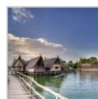
Pfahlbaumuseum, Panorama.