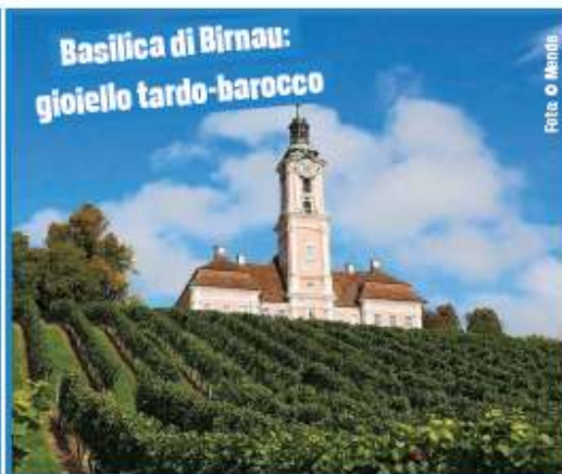
Basilica di Birnau: gioiello tardo-barocco