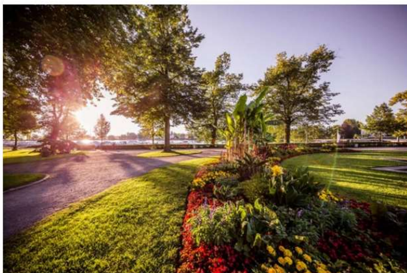
Giardini di Lindau

Altre mete se amate giardini e parchi, Salem , il più antico convento cistercense del Bodensee e fra le abbazie un tempo più influenti del territorio, nasconde dentro le sue mura giardini curati dove in primavera fioriscono gli alberi di ciliegio e un'elegante orangerie. Nelle cantine del convento, che custodiscono un antico torchio per la pressa dell'uva, è possibile degustare i vini del margravio del Baden. Sul lungolago tedesco, Lindau è famosa per i suoi parchi , molti dei quali furono realizzati tra l'Ottocento e il Novecento, quando la cittadina divenne una celebre località di villeggiatura. Negli ultimi anni anche Überlingen ha reinventato i suoi spazi verdi e ridisegnato i suoi giardini e la promenade sul lago, arricchendosi di aree di gioco e di svago, perfetto esempio di armonia tra architettura di città e cura del paesaggio.