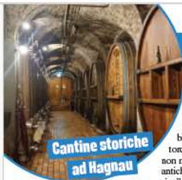
Cantine storiche ad Hagnau

(segue da pag. 73) zona. In particolare, superata la deliziosa Lindau , dal caratteristico borgo medievale, unico affaccio bavarese sul lago, ed entrati nella regione del Baden-Württemberg, ci si può facilmente imbattere nei vigni del Müller-Thurgau, che quest'anno celebrano un'importante ricorrenza: nel 2025 si festeggiano infatti i 100 anni dall'arrivo sulle sponde tedesche del lago di questo pregiato incrocio vitivinicolo, trafugato dalla vicina Svizzera con l'intento di risolvere le difficili sorti economiche dei contadini tedeschi. A Immenstaad si può visitare la casa vinicola Roehrenbach, per pernottare con vista idilliaca sui vigneti e sulle acque del lago. La cantina è ancora di proprietà della famiglia del giovane viticoltore che, in una notte di aprile del 1925, vi portò il vitigno. Non si contano, tuttavia, lungo le sponde del lago, le cantine o i Winzer-