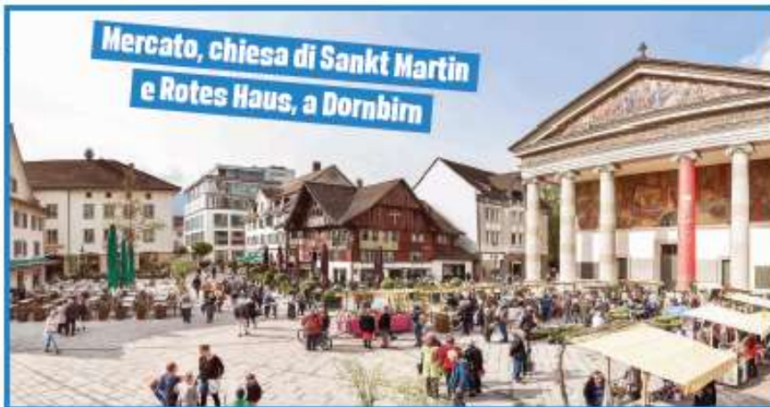
Mercato, chiesa di Sankt Martin e Rotes Haus, a Dornbirn