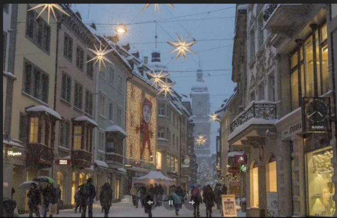
Sternenstadt, St.Gallen-Bodensee Tourismus