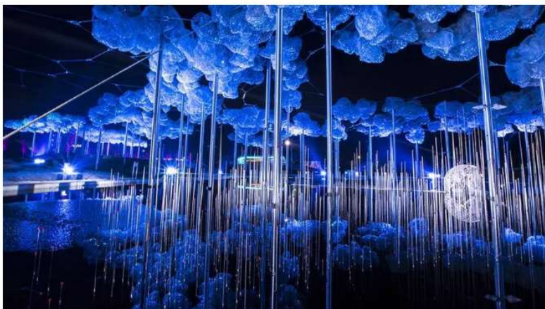
Installazioni a "I mondi di cristallo" a Wattens (Austria)

Genova. Sì, proprio Genova . Perché se tutti sanno di Napoli e dei suoi presepi in terracotta, bisogna anche sapere che il capoluogo ligure ha una lunga tradizione di presepi lignei. Anche per questo inverno è previsto "Tempo di presepi" con decine di allestimenti, e con iniziative e animazioni in tutta la città. Tra le mostre, interessante "Il presepe del Re" con le figure commissionate da Casa Savoia a un artista genovese. Hotel: B&B Hotel proprio di fronte alla stazione Piazza Principe.