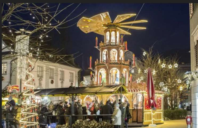
Weihnachtsmarkt Bregenz (Kornmarktplatz)