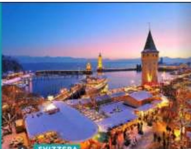
6 SVIZZERA SWITZERLAND