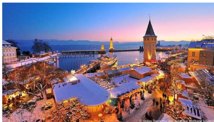
Mercatino sul porto di Lindau, Lago di Costanza