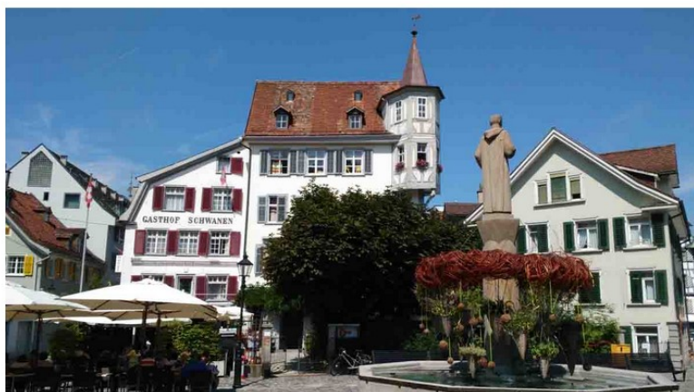
San Gallo Svizzera, cosa vedere in questa deliziosa città

San Gallo Svizzera, cosa vedere – San Gallo è proprio come un gioiello. Uno di quei gioielli che sono più preziosi di altri perché di altissima manifattura, rari e senza tempo.