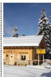
La baita del Neff

Sciare all'alba è un privilegio di pochi. La proposta #Trentinoskisunrise, grazie ad aperture degli impianti anticipate, consente di godere delle prime luci del sole sulle cime candide, dell'aria frizzante, di neve immacolata e di un paesaggio alpino mozzafiato. Il tutto abbinato ad una ricca e gustosa colazione dolce e salata con sapori tradizionali locali. Poi tutti in pista, con i maestri di sci, per essere i primi a poter solcare le piste ancora immacolate, principalmente con gli sci, ma anche con le ciaspole. Domani 21 gennaio l'appuntamento sarà al Rifugio del Neff a Luserna, baita sudici