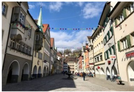
Viaggio nel Bodensee Vorarlberg: Feldkirch, la vecchia Piazza del Mercato