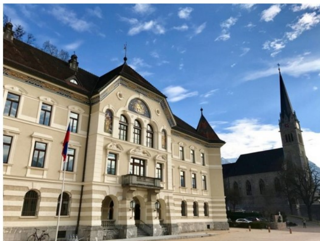
Viaggio nel Bodensee: Principato del Liechtenstein, Vaduz

Un piccolo regno "guidato" ormai da 300 anni da un'amatissima famiglia reale, quella dei Liechtenstein , che vive in un meraviglioso castello delle fiabe (che purtroppo non è possibile visitare) sulla cima di una rupe con torri, bandiere e stemmi.