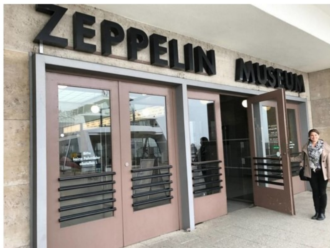
Visitare il Lago di Costanza: Friedrichshafen, Zeppelin Museum

Un motivo per visitarla? Posso darvene due, per iniziare.