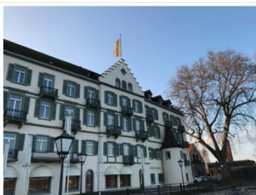
Viaggio nel Bodensee: Steigenberger Inselhotel, Costanza

Il modo migliore per godere a pieno della città è quello di prenotare una camera vista lago allo Steigenberger Inselhotel , un antico monastero domenicano trasformato in hotel di charme , a soli tre minuti a piedi dal centro storico.