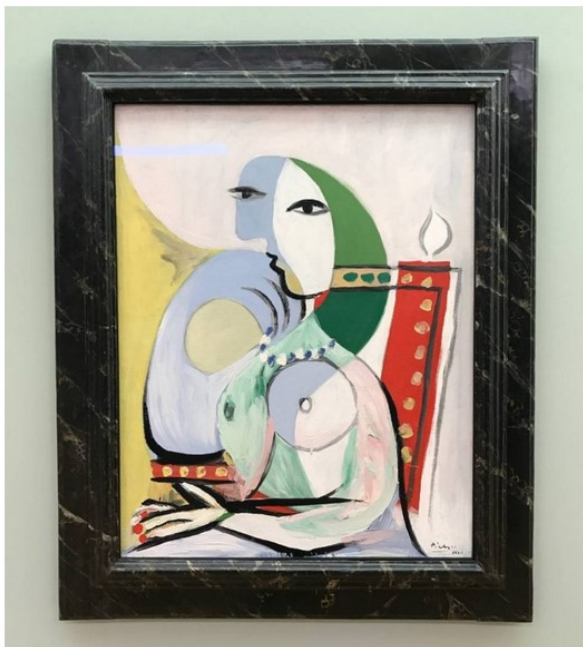
Viaggio nel Bodensee: Kunstmuseum Liechtenstein, Picasso

Per gli appassionati di arte moderna merita sicuramente una visita il Kunstmuseum Liechtenstein , un museo d'arte contemporanea con un'interessante esposizione permanente, la Hilti Collection Art Foundation , che vanta tra gli altri un bellissimo Picasso, ed alcune esibizioni temporanee, ultima in ordine di tempo Who Pays? , dedicata al "senso del denaro" nell'ultimo ventennio.