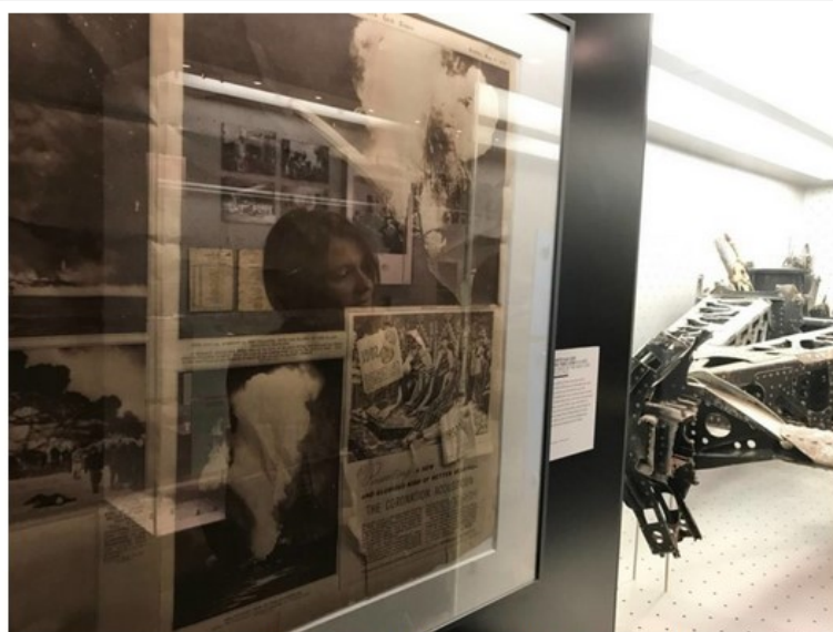
Visitare il Lago di Costanza: Friedrichshafen, Zeppelin Museum, particolari

Lo Zeppelin Museum , interamente dedicato all'epopea dei famosi dirigibili ideati dal geniale e visionario Conte Ferdinand Von Zeppelin , costruiti proprio a Friedrichshafen ed utilizzati per le trasvolate oceaniche a partire dal 1904 fino al 1937, anno del tragico incidente avvenuto nei pressi di New York allo Zeppelin LZ 129 Hindenburg che decretò di fatto – assieme all'avvento della II Guerra Mondiale – la fine dell'epoca degli Zeppelin.