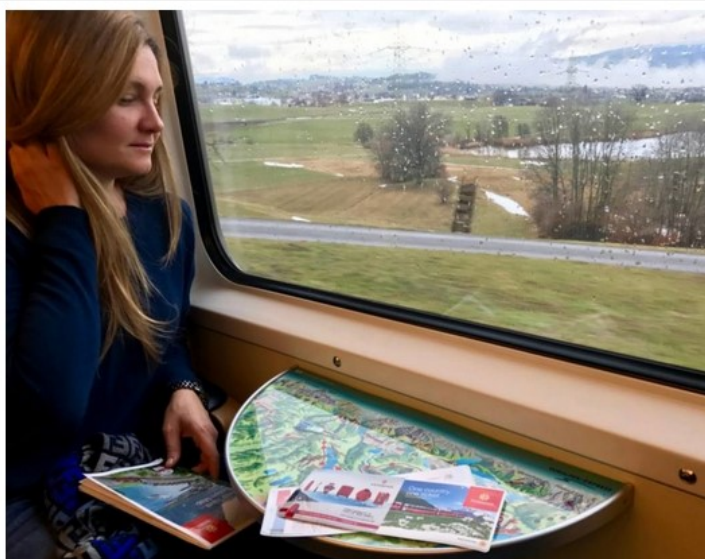
Il mio viaggio nel Bodensee inizia con lo Swiss Travel System Pass per muovermi in autonomia con le ferrovie svizzere