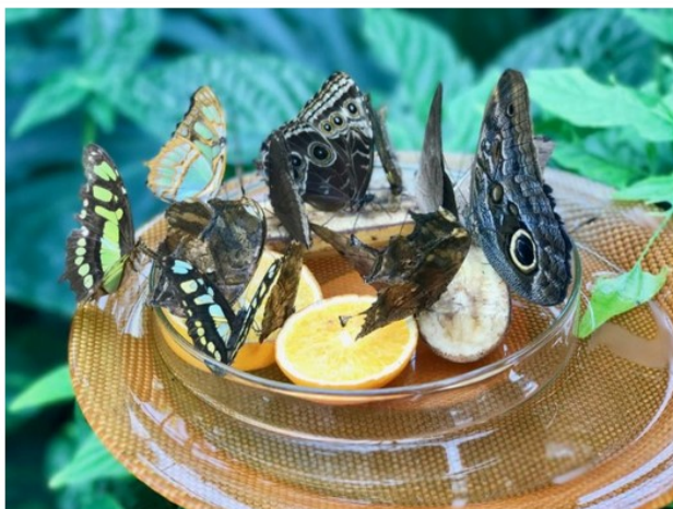
Viaggio nel Bodensee: Isola di Mainau, la "casa delle farfalle"

Grazie alle particolari condizioni climatiche qui le piante (e farfalle tra le specie più rare) proliferano creando dei veri e propri micro-ambienti in cui è possibile assistere a spettacoli come la fioritura di ben 30.000 rose di più di 1200 specie diverse, di quella delle azalee, dei rododendri e del milione e mezzo di tulipani che ogni anno richiamano migliaia di turisti da tutto il mondo.