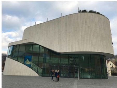
Il Mont Fort Haus

Una cittadina medievale perfettamente conservata ed integrata da alcune pregevoli costruzioni moderne, come l'innovativo centro congressi Mont Fort Haus in cui vengono prodotti spettacoli, eventi legati al turismo e concerti.