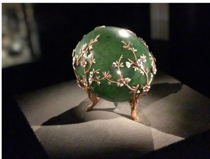
Liechtensteinisches Landesmuseum, Camera del Tesoro

Ci si ritrova a passeggiare tra pezzi unici di Uova di Faberge (una collezione ancora più grande di quella dello Zar Nicola II conservata a Mosca), oggetti antichi provenienti dai reali di mezza Europa, quadri, documenti che testimoniano l'influenza avuta in molti grandi avvenimenti storici, e la preziosa " Corona del Liechtenstein ", mai utilizzata – mi raccontano – perché i principi sono noti (e forse per questo così amati) per la loro sobrietà e per la scelta di non prendere parte a cerimonie di investitura.