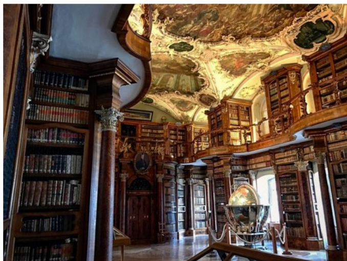
Viaggio nel Bodensee: la Biblioteca di San Gallo

Un tesoro prezioso – frutto del lavoro certosino dei monaci amanuensi nei secoli – di 170.000 volumi di cui solo 30.000 esposti all'anno. 2000 manoscritti dal valore incommensurabile tra cui 400 risalenti al primo millennio, incluse alcune preziose bibbie miniate del V Sec.