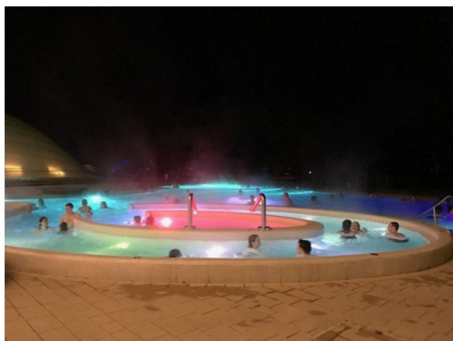
Viaggio nel Bodensee: Therme Konstanz

Il consiglio è quello di prendervi tempo per passeggiare nel quartiere medievale, ammirare gli edifici storici e gli scorci caratteristici delle vecchie case a graticcio, perdersi nei negozi di antiquariato, fermarvi per una dolce pausa in uno dei numerosi caffè che affollano le vie a ridosso del lungo lago e magari concedervi qualche ora di puro relax nel vicino complesso termale, Therme Konstanz , direttamente sulla sponda ovest del lago.