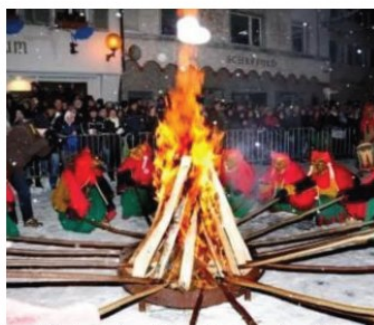
I fuochi che si accendono alla fine del Carnevale sul lago di Costanza

FERRARA. Dal 23 al 26 febbraio a Ferrara (nella foto in alto) tornano fasti e atmosfere di duchi e duchesse del '400 e '500, rendendo omaggio ad Eleonora d'Aragona. I palazzi antichi, il Castello Estense, le grandi piazze e strade di Ferrara catapultano chiunque arrivi nel mondo del Rinascimento. Il tema del Carnevale 2017 sarà "Luna, sole e pianeti". Il corteo storico partirà alle 16 di sabato 25 febbraio da Palazzo Schifanoia e attraversando il cuore storico della città raggiungerà piazza Municipale, dove an-