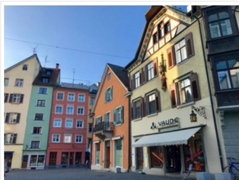
Viaggio nel Bodensee: Costanza