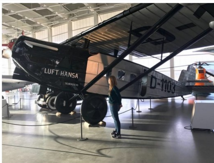
Friedrichshafen, Dornier Museum

Il museo si trova fuori dal centro, nei pressi dell'aeroporto di Friedrichshafen, proprio di fronte al capannone in cui oggi vengono realizzati i nuovi Zeppelin.