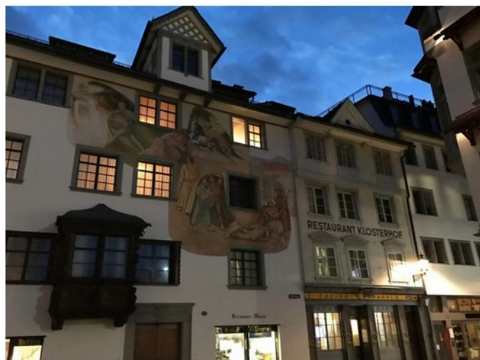
Viaggio nel Bodensee: San Gallo

San Gallo è la città dei monaci, dei monasteri e dei mercanti, delle tipiche case a graticcio e dei grandiosi edifici in stile Liberty, dei Bovindi , le caratteristiche finestre ad arco che adornano il centro storico, dei famosi pizzi e delle tele, delle opere di Calatrava (eh sì, anche qui) e della cultura intesa come sapere trasmesso nei secoli, meravigliosamente serbato in una delle più antiche e preziose biblioteche al mondo.