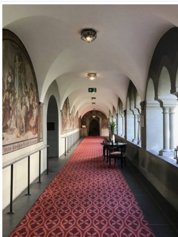
Viaggio nel Bodensee: Steigenberger Inselhotel, interno