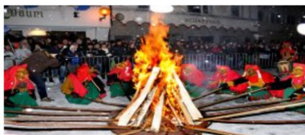
Falò di carnevale – Lago di Costanza,