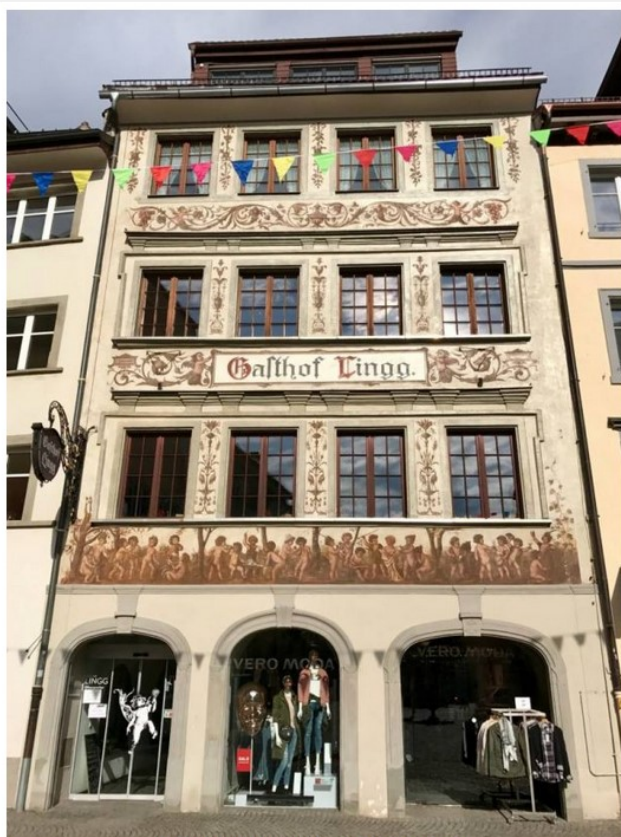
Viaggio nel Bodensee Vorarlberg: Feldkirch, particolari

Un consiglio per pernottare ed uno per degustare.