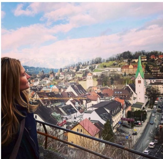
Viaggio nel Bodensee Vorarlberg: Feldkirch, vista dal Castello di Shattenburg

Un piccolo mondo antico in cui sono transitati, talvolta scrivendone, personaggi del calibro di James Joyce, Thomas Mann ed Arthur Conan Doyle, il "padre" di Sherlock Holmes, ed in cui sono state girate alcune scene (proprio nella vecchia Piazza del Mercato) di "A Quantum of Solace" uno degli ultimi film di James Bond con Daniel Craig.