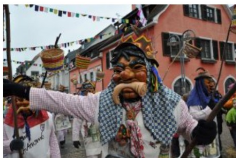
Dorausschreier (urlatore alla porta) – Lago di Costanza, Svizzera

Non si può perdere la tradizionale Aaguggete a San Gallo , che dà il via ai festeggiamenti del Fasnet: alle 06.00 della mattina del giovedì grasso, sulla piazza del mercato, la città esce dal torpore notturno e festeggia il Carnevale con maschere, balli, coriandoli e la tradizionale Guggenmusik carnevalesca. In città si continua a festeggiare con tanti eventi fino al martedì grasso. Chi cerca maschere e cortei nel vicino Principato del Liechtenstein li troverà nel paese di Schaan , dove il carnevale è particolarmente sentito. Spettacolo finale del carnevale sul Bodensee sono, la sera del martedì grasso che precede il mercoledì delle Ceneri ( 28.02.2017 ), i grandi falò con i quali si brucia una strega, simbolo degli eccessi e delle follie passate, accompagnati dai lamenti dei giullari e delle altre maschere della quinta stagione dell'anno. Nel Vorarlberg , invece, i fuochi vengono accesi la prima domenica di quaresima.