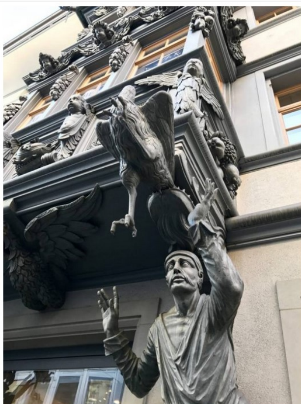
Viaggio nel Bodensee: San Gallo, i "Bovindi"