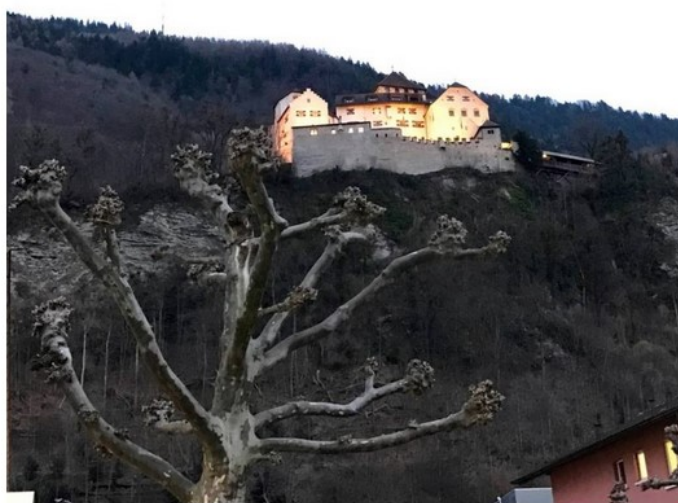
Viaggio nel Bodensee: Principato del Liechtenstein, Vaduz il Palazzo Reale

La capitale, Vaduz , dove si trova il castello ed alcuni bellissimi musei è a poche decine di km dall'Austria, si raggiunge facilmente in meno di un'ora di bus dalla stessa Feldkirch o nel senso opposto da Sargans in Svizzera.