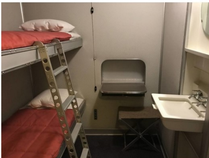
Visitare il Lago di Costanza: Friedrichshafen, una cabina passeggeri dello Zeppelin

E, per gli appassionati del genere, il Dornier Museum , incentrato sulla vita ed i progetti di Claude Dornier , il giovane ingegnere selezionato dal Conte Zeppelin in persona che divenne poi il pioniere dello sviluppo aeronautico, dagli idrovolanti, agli aerei di linea, a quelli utilizzati in guerra fino ai prototipi da inviare nello spazio.