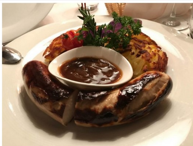
Viaggio nel Bodensee: una delle specialità proposte dal Restaurant Schlössli

Il Sorell City Weussenstein , un moderno e confortevole hotel/residence (con camere ed appartamenti) a pochi passi dalla stazione ferroviaria ed immediatamente a ridosso del centro storico.