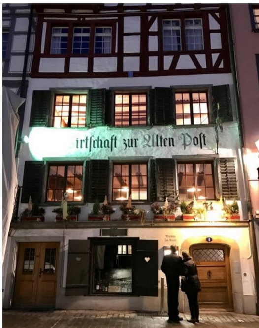
Scoprire il lago di Costanza: san gallo, le tipiche costruzioni "a traliccio"

Un'incredibile voglia di tornare per vedere e saperne di più – credetemi, una volta non basta – e visitare il Lago di Costanza in altre stagioni per farmi sorprendere ancora una volta.