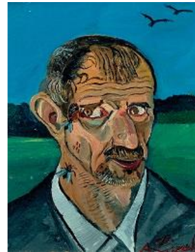
Immagine: Antonio Ligabue, Autoritratto con mosche, Collezione privata ©